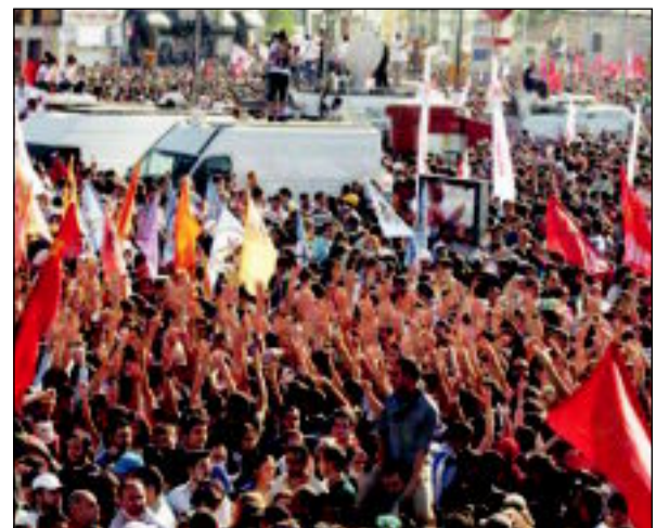
احتجاجات في ميدان «تقسيم» في إسطنبول ضد حكومة أردوغان