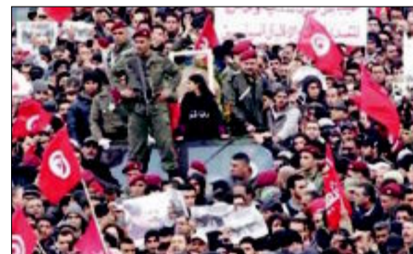
جنازة بلعيد تقدر غضباً شعبياً ضد «النهضة» في تونس