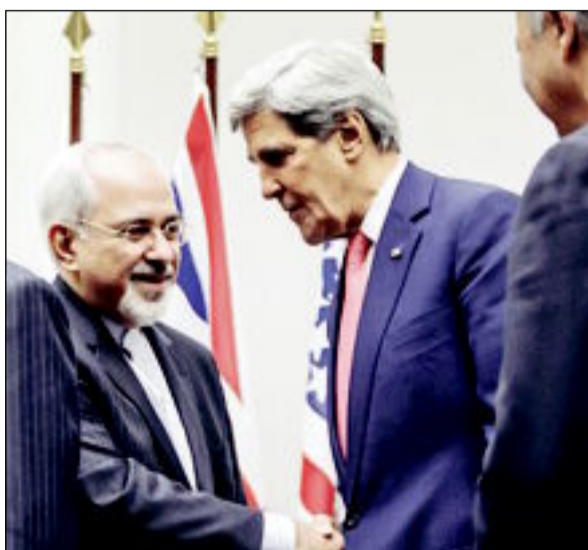
مصافحة تاريخية بين كيري وظيفر في جنيف