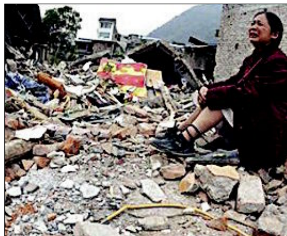
دمار اثر زلزال ضرب منطمة ثمانية في جنوب غربي الصين