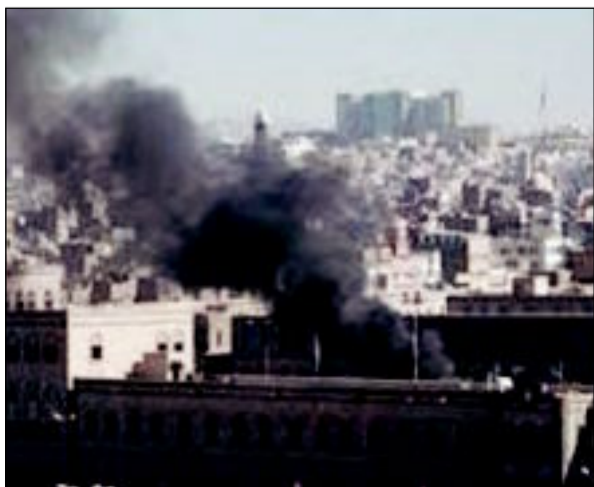
هجوم لـ «القاعدة» استهدف مستشفى العرضي في مجمع وزارة الدفاع في صنعاء