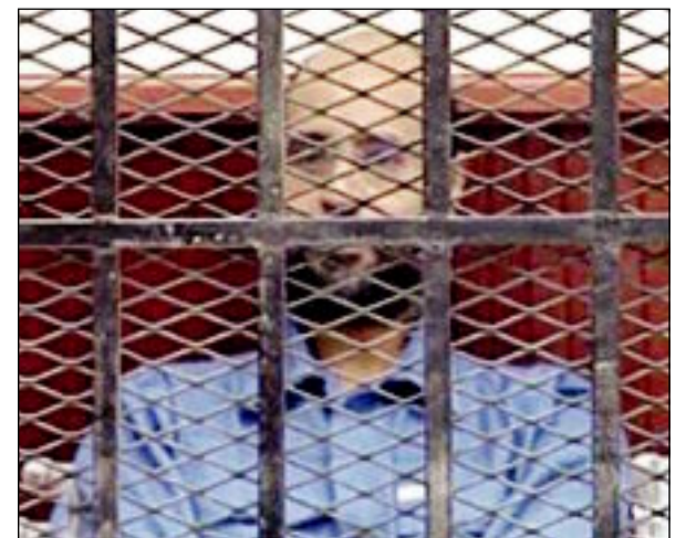
سيف الإسلام يمثل أمام المحكمة في ليبيا