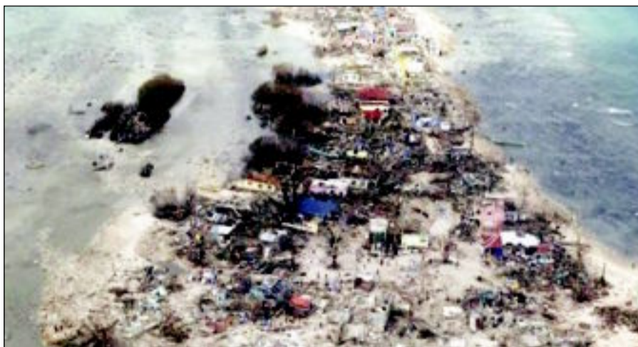
دمار واسع خلفه إعصار «هايان» في الفيليبين

- روحاني يؤكد خلال خطاب القسم امام مجلس الشورى ان