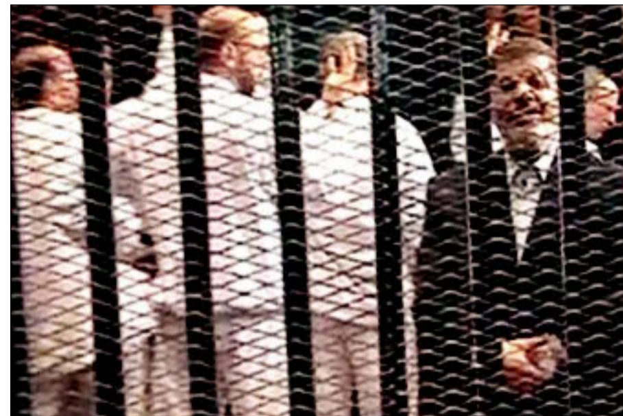
مرسي داخل قفص المحكمة

مؤيدين لمرسي ومعارضين. - 6: مقتل 34 شخصا على الأقل في اشتباكات دارت في أنحاء مختلفة من البلاد بين مؤيدين لمرسي ومعارضين بمناسبة احتفالات الذكرى الأربعين لحرب أكتوبر 1973.