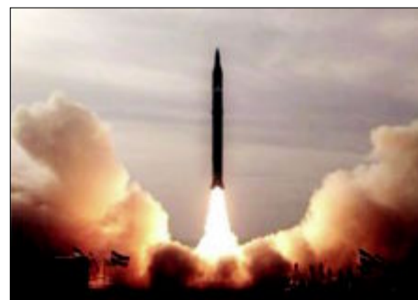
كوريا الشمالية تعلن نجاحها في إجراء تجربة نووية ثالثة