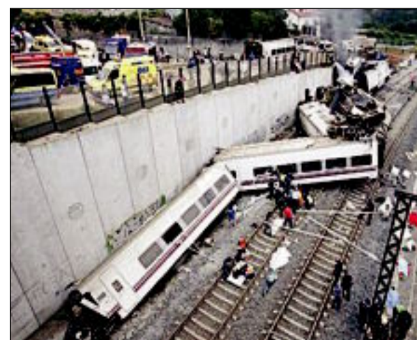
أسوأ حادث قطارات عرفته إسبانيا في تاريخها