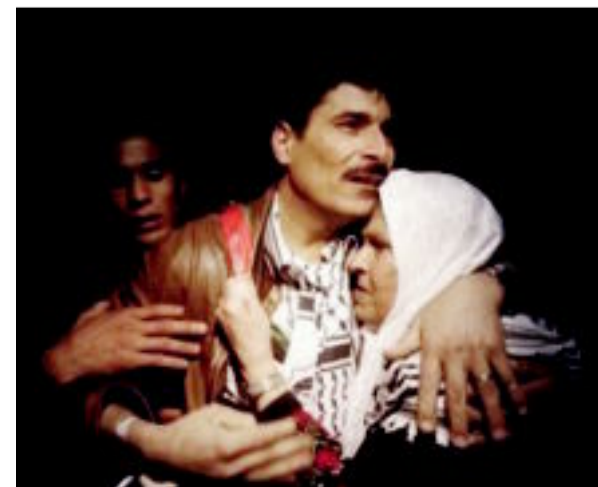
إسرائيل تفرج عن أسرى فلسطينيين