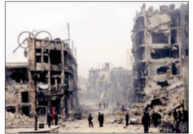
دمار واسع في أحد أحياء حمص

○ أوباما يعين جون كيري وزيراً للخارجية خلفاً لهيلاري كلينتون