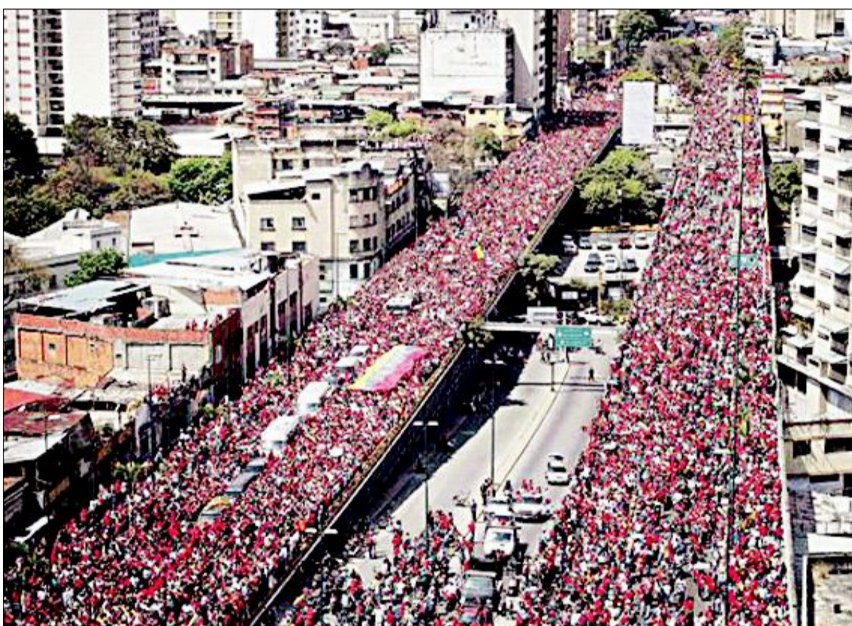
جثمان شافيز شق طريقه بصعوبة بين الحشود خلال رحلته الأخيرة من المستشفى إلى الأكاديمية