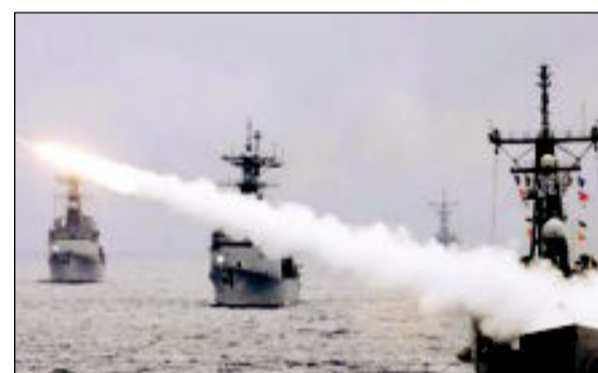
تجربة صاروخية إسرائيلية مشتركة مع أميركا في البحر المتوسط