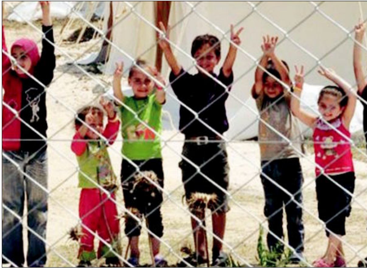
أطفال سوريون لاجئون في تركيا

الارجنتيني، خورخي ماريو برغوليو، ليكون الزعيم الجديد للكنيسة الكاثوليكية وأول بابا غير أوروبي منذ نحو 1300 عام وأول بابا من الأميركيين في التاريخ، في الثالث عشر من مارس حدثاً غير عادي، كما انتهى العام بحدث مرتبط بهذا الحدث وهو اختيار البابا فرنسيس (اسمه الجديد) ليكون شخصية العام وفقاً لاستفتاء مجلة «تايم» الأميركية.