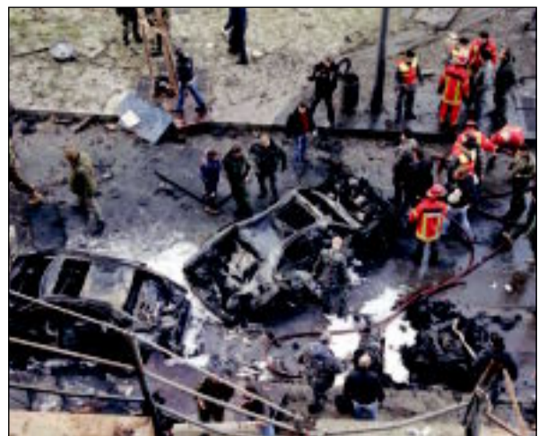
مسرح الجريمة في قلب بيروت بعد اغتيال شطح