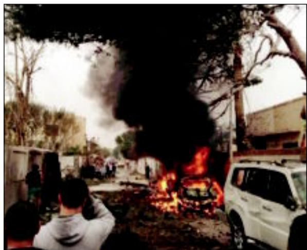
تفجير يستهدف مركزاً للشرطة في بنغازي