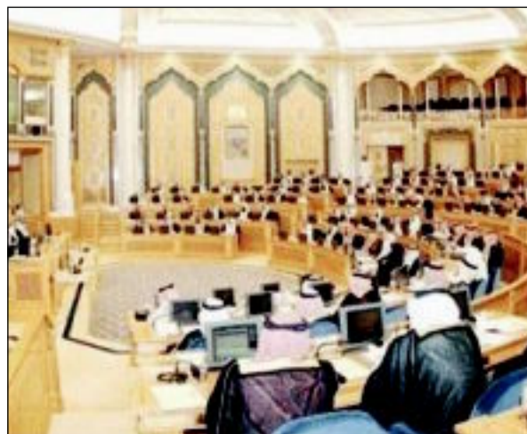
أول مجلس شوري سعودي يضم 30 امرأة