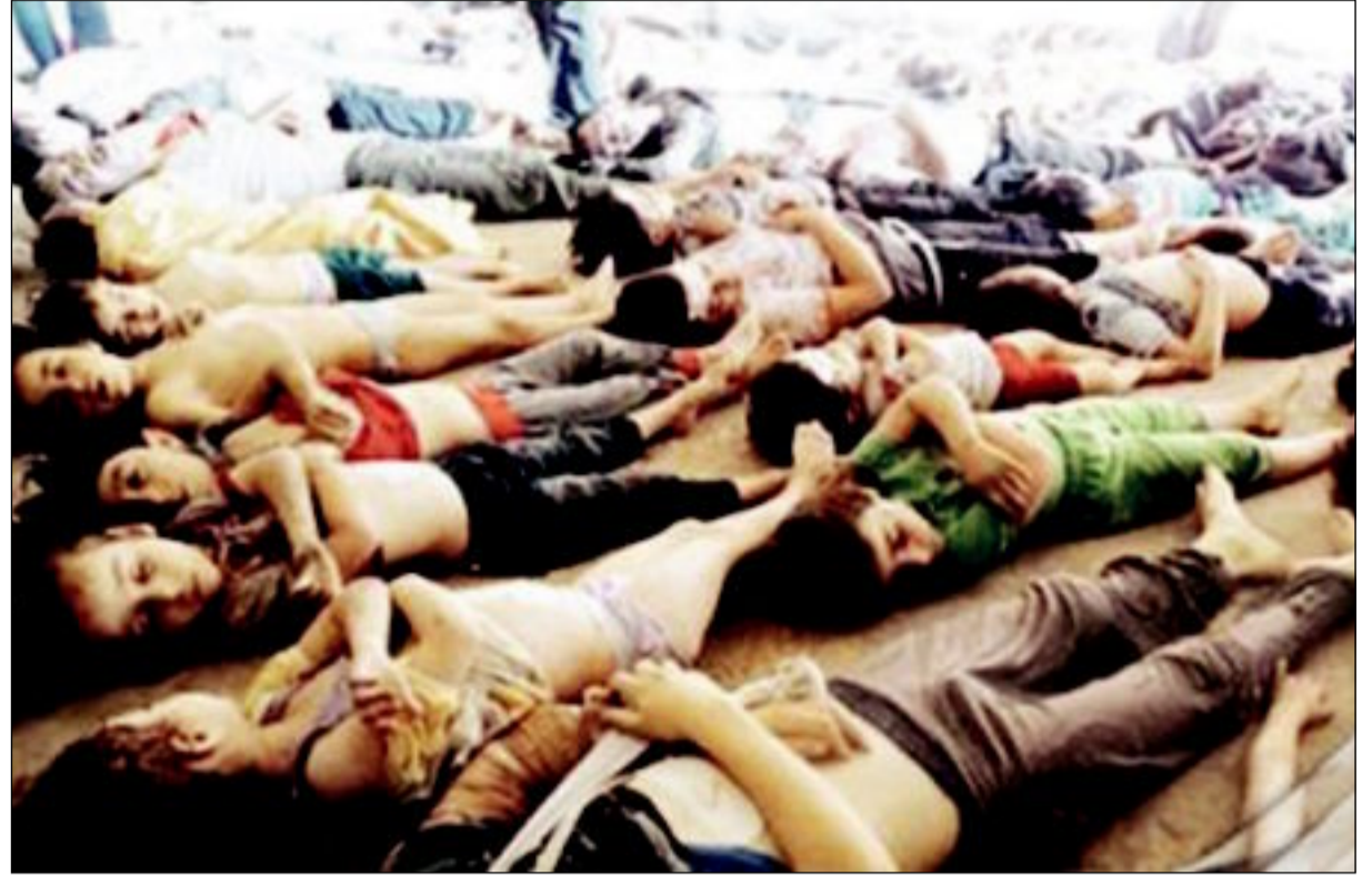
جثامين أطفال قتلتوا في هجوم «الكيماوي» في ريف دمشق

وفي السودان كادت الأوضاع تتفجر حيث خرج المواطنون إلى الشوارع احتجاجاً على سياسة حكومة عمر البشير الاقتصادية وارتفاع الأسعار ومازال الوضع متوتراً حتى بعد تغيير الحكومة، فيما تفجر صراع على السلطة في جنوب السودان بين الرئيس سالفاً كبير ونائبه ريك مشار على اثر محاولة انقلابية لآخر.