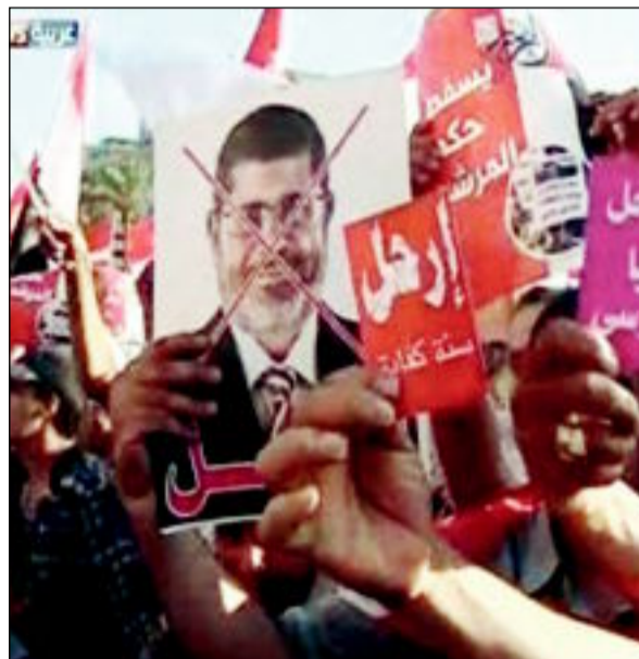
تظاهرات في القاهرة تطالب برحيل مرسي