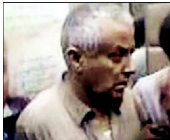
رئيس الوزراء الليبي علي زيدان بعد اختطافه لساعات