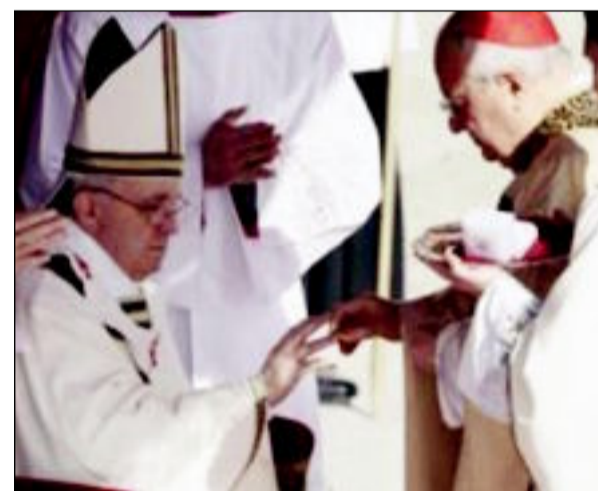
مراسم تنصيب البابا فرنسيس في ساحة القديس بطرس في الفاتيكان

○ 52 قتيلاً في هجوم استهدف وزارة الدفاع في صنعاء