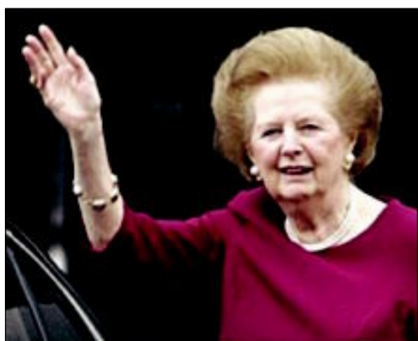
جلمة دماغية توقف مسيرة سيدة بريطانيا الحديدية