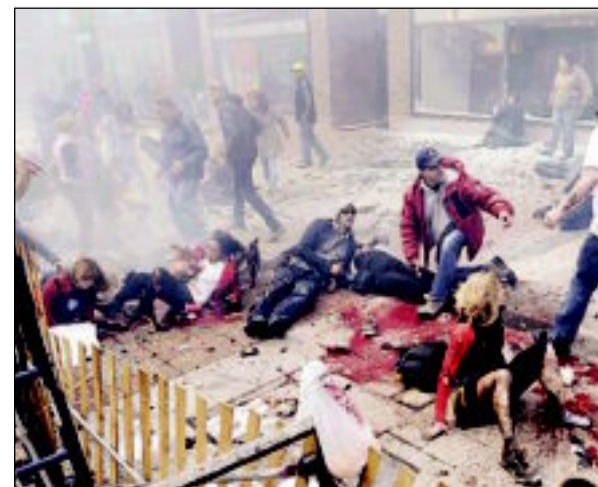
ضحايا التفجير مضرجون بدمانهم عند خط النهاية لماراثون بوسطن