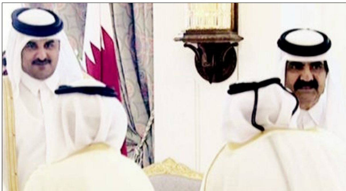
الشيخ حمد بن خليفة يسلم الحكم لنجله الشيخ تميم

ذهب ضحيتها أكثر من 80 قتيلًا، وأصيب 160، في أضخم هجوم من نوعه يستهدف جامعة سورية منذ اشتعال الأزمة قبل سنتين. - هولاند يبحث في الإمارات الدعم الخليجي لحربه في مالي. - كارثة قطار البدرشين في الجزيرة مقتل 19 مجننا وجرح 117. - فرنسا تتدخل عسكريا في مالي لوقف زحف «القاعدة». - مقتل 41 رهينة اجنبية من العاملين في منشأة «بريتش بتروليوم» بينهم 7 أميركيين، و13 درويجا، و5 يابانيين في الجزائر. - سيف الاسلام القذافي يمثل امام محكمة ليبية.