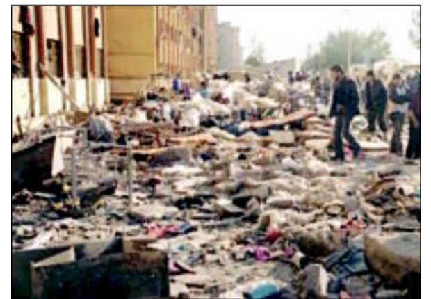
تفجير استهداف الحرم الجامعي في حلب

○ واشنطن تلغي ضربة عسكرية ضد النظام إثر تدخل موسكو والتوصل إلى اتفاق لنزع السلاح الكيماوي