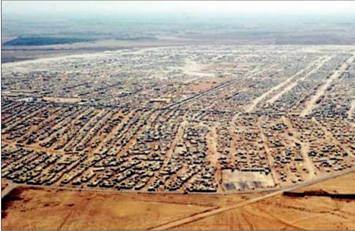
مخيم الزعتري في الأردن تحول إلى موطن ثانٍ للاجئين السوريين