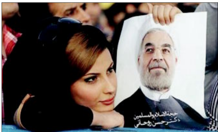
فتاة إيرانية تحمل صورة لحسن روحاني بعد فوزه بالانتخابات الرئاسية