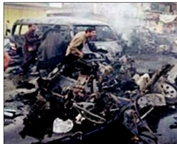
تفجير مجلس عزاء في قضاء ابو غريب