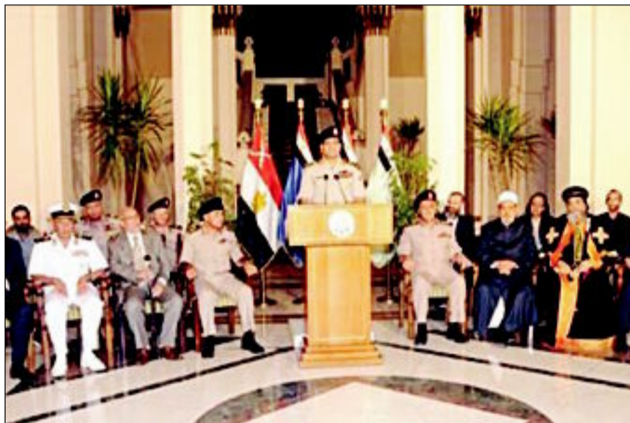
القوات المسلحة تعلن خريطة الطريق بعد عزل مرسي