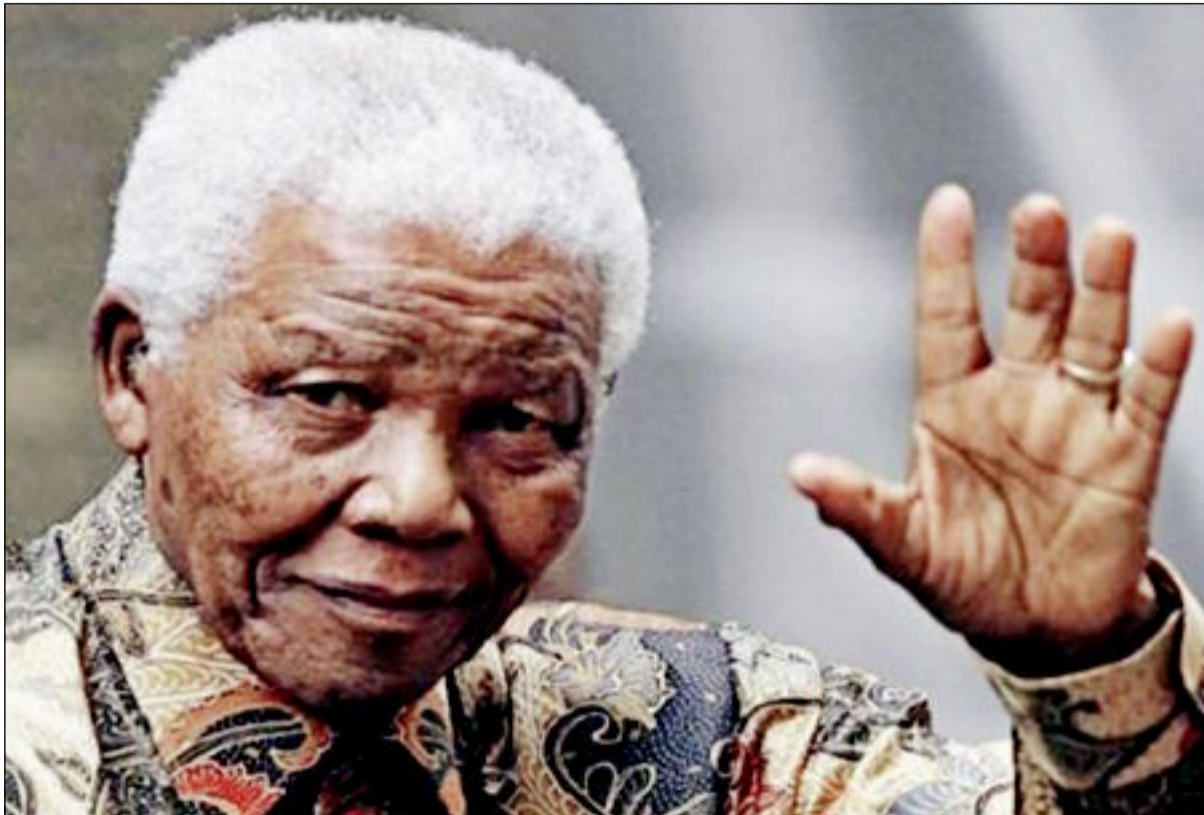
الزعيم الراحل نيلسون مانديلا

- الجيش النظامي السوري يحكم سيطرته على معظم بلدة النيك في القلمون بعد إحكام سيطرته على مدينة دير عطية. - نائب الرئيس الأميركي جو بيدن يؤكد إن الخطوة الصينية بإعلان منطقة دفاع جوي صيني هي محاولة لتغيير الوضع القائم في شرق بحر الصين. - وزير الخارجية الإيراني محمد جواد ظريف أجرى جولة خليجية وكشف إنه يصدد زيارة للسعودية. - اغتيال حسان اللقيس أحد قيادي «حزب الله» في لبنان والحزب يتهم إسرائيل. - وفاة المناضل الجنوب أفريقي ضد التمييز العنصري نيلسون مانديلا وأكثر من 100 رئيس دولة وحكومة شاركوا في وداعه. - 52 قتيلاً في هجوم استهدف وزارة الدفاع في صنعاء. - كوريا الجنوبية توسع منطقة دفاعها الجوي لتتداخل مع الصين. - مجلة «التايم» تختار البابا فرنسيس شخصية العام 2013. - سلسلة جديدة من الهجمات الدامية في العراق تسفر عن 42 شخصاً على الأقل. - حملة تطهير واعتقالات في صفوف الشرطة التركية بسبب فضيحة فساد. - 13 قتيلاً في أول هجوم انتحاري شرق بنغازي. - اغتيال وزير المال اللبناني السابق محمد شطح في بيروت.