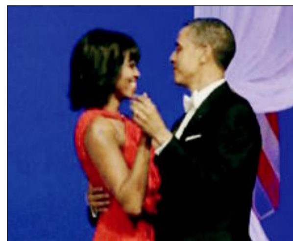
أوباما وزوجته ميشيل احتفالاً بتنصيبه لولاية رئاسية ثانية