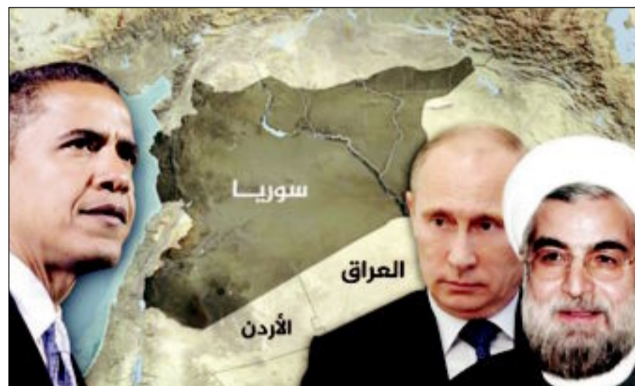
أرباح اتفاق جنيف وتكاليفه

في تونس شكري بلعيد يشعل البلاد غضباً واحتجاجات ووضوح حركة «النهضة» الحاكمة أمام مازق كبير بعدما حملتها المعارضة مسؤولية الجريمة. - أوباما رفض تسليح المعارضة السورية لحماية أميركا وإسرائيل وهولاند يستبعد رفع أوروبا الحظر على الأسلحة. - مقتل رئيس الهيئة الإيرانية لإعادة الاعمار في لبنان حسام خوش نقيس على طريق عودته من دمشق الى بيروت. - 8 سيارات مفخخة تهزّ أحياء شعبية في بغداد. - تجربة نووية ثالثة لكوريا الشمالية والغرب يشدد عليها الحصار الاقتصادي. - رئيس الوزراء التونسي حمادي الجبالي يفي بوعدته ويقدم استقالته إلى الرئيس منصف المرزوقي. - أول مجلس شوري سعودي يضمّ نساء أدى اليمين أمام الملك عبدالله. - 53 قتيلاً وأكثر من 200 جريح في تفجير انتحاري. - وداغ مؤثر لبينديكتوس الـ 16: أرى أن الكنيسة حية.