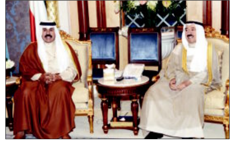
الأمير مستقبلاً ولي العهد