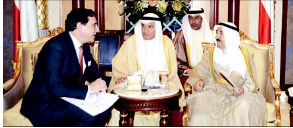
...وسفير إسبانيا الذي سلمه رسالة الملك خوان كارلوس

كونا - استقبل سمو الأمير الشيخ صباح الأحمد، بقصر بيان صباح أمس، سمو ولي العهد الشيخ نواف الأحمد. كما استقبل سموه رئيس مجلس الأمة مرزوق الغانم. والتقى سموه بسمو الشيخ جابر المبارك رئيس مجلس الوزراء. كما استقبل سمو الأمير، النائب الأول لرئيس مجلس الوزراء وزير الخارجية الشيخ صباح الخالد. والتقى سموه ظهر أمس، وزير المالية أنس الصالح، والعضو المنتخب للهيئة العامة للاستثمار بدر السعد.