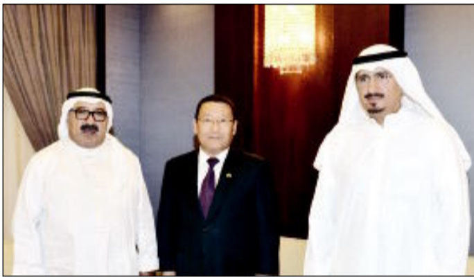
ناصر الصباح مستقبلاً سفير بوتان

كونا - استقبل وزير شؤون الديوان الأميري الشيخ ناصر الصباح أمس، سفير مملكة بوتان لدى الكويت داشو تاشي بنسوج. وبحث الجانبان خلال اللقاء العلاقات الثنائية بين البلدين الصديقين.