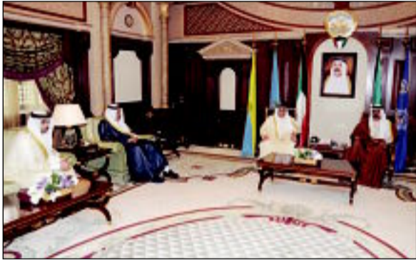
...والجراح والحمود والعدالله

كونا - استقبل سمو الأمير الشيخ صباح الأحمد، بقصر بيان صباح أمس، سمو ولي العهد الشيخ نواف الأحمد. كما استقبل سموه رئيس مجلس الأمة مرزوق الغانم. والتقى سموه بسمو الشيخ جابر المبارك رئيس مجلس الوزراء. كما استقبل سمو الأمير، النائب الأول لرئيس مجلس الوزراء وزير الخارجية الشيخ صباح الخالد. والتقى سموه ظهر أمس، وزير المالية أنس الصالح، والعضو المنتخب للهيئة العامة للاستثمار بدر السعد.