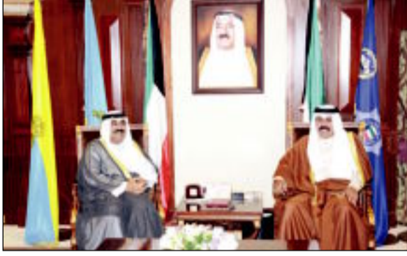
ولي العهد مستقبلاً مشعل الأحمد

كونا - يشمل سمو ولي العهد الشيخ نواف الأحمد، برعايته مؤتمر التعليم الفني والتدريب المهني الأول، الذي تنظمه الهيئة العامة للتعليم التطبيقي والتدريب بعنوان (تحديات الحاضر... وأفاق المستقبل). وقد أنساب سموه وزير التربية وزير التعليم العالي أحمد المليفي لحضور حفل صباح اليوم، في فندق ومنتجع الجميرا. واستقبل سمو ولي العهد بقصر بيان أمس رئيس مجلس الأمة مرزوق الغانم. واستقبل سموه نائب رئيس الحرس الوطني الشيخ مشعل الأحمد. كما استقبل سموه سمو الشيخ جابر المبارك رئيس مجلس الوزراء واستقبل رئيس مجلس الوزراء النائب الأول لرئيس مجلس الوزراء وزير الخارجية الشيخ صباح الخالد. واستقبل سمو ولي العهد نائب رئيس مجلس الوزراء وزير الداخلية الشيخ محمد الخالد. واستقبل نائب رئيس مجلس الوزراء وزير الدفاع الشيخ خالد الجراح. كما استقبل سموه وزير الإعلام وزير الدولة لشؤون الشباب الشيخ سلمان الحمود. كما استقبل سموه وزير الدولة