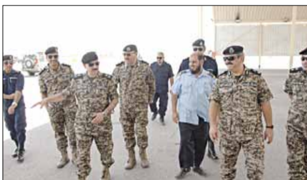
قائدو المنفذ في استقبال المهنا

تسهيل حركة المغادرين حيث شهد المنفذ توافد الكثيرين من المواطنين والمقيمين لمغادرة البلاد لإداء مناسك العمرة أو الزيارة.