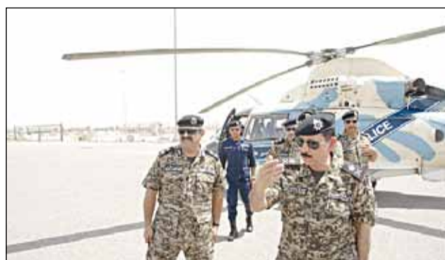
المهنا لدى هبوطه بالهليكوبتر

وكان اللواء المهنا أكد خلال جولته في كافة المنافذ أن العاملين في المنافذ يواصلون العمل على مدار الساعة لخدمة الوطن والمواطنين في كافة المناسبات الدينية والوطنية بعيداً عن أهاليهم وأسرتهم، مؤكداً أن أمن الوطن غايتهم، وأمان مواطنيه هدفهم.