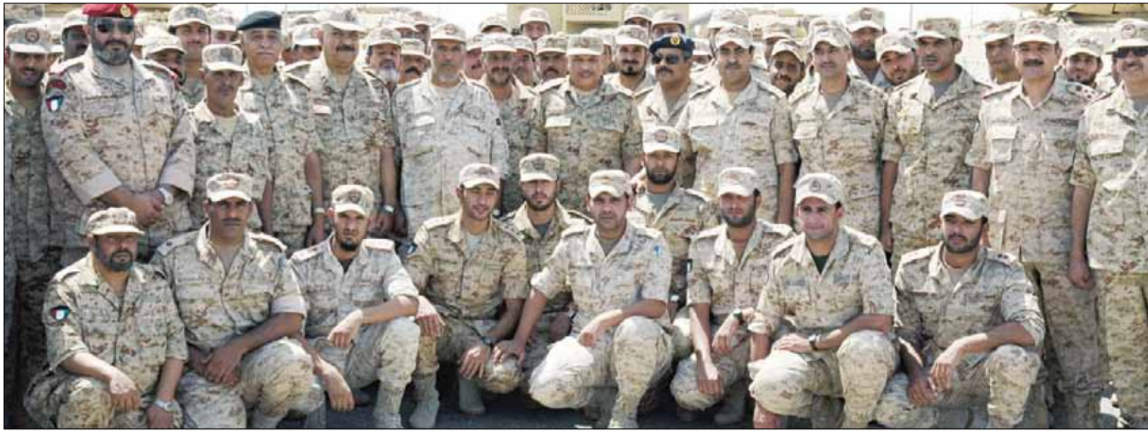
الفريق الجراح متوسط قوة الواجب

رئيس الأركان بالإنيابة تفقد قوة الواجب من لواء السور الآلي 26/