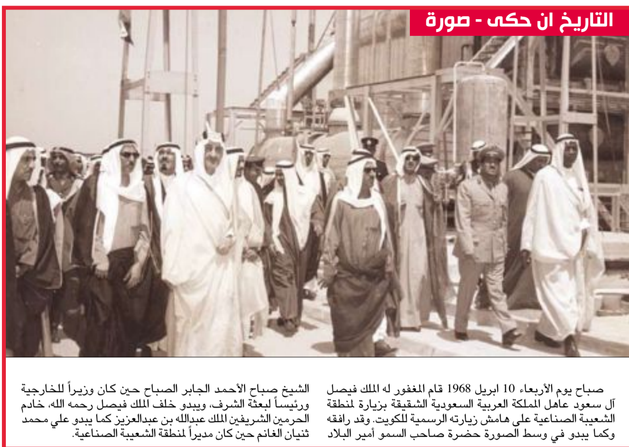
التاريخ ان حكمي - صورة

صباح يوم الأربعاء 10 ابريل 1968 قام المغفور له الملك فيصل آل سعود عامل المملكة العربية السعودية الشقيقة بزيارة لمنطقة التنمية الصناعية على هامش زيارته الرسمية للكويت، وقد رافقه وكما يبدو في وسط الصورة حضرة صاحب السمو أمير البلاد