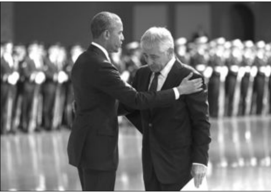
الرئيس باراك أوباما خلال حفل وداغ أقيم لهيغل في قاعدة مايبور هندرسون العسكرية في فيرجينيا

وهذه المسألة بالغة الحساسية لإدارة أوباما الذي يتهمه المحافظون بالالتفاف على الكونغرس للقيام بعملية التبادل هذه وبأنه قدم تنازلات كبيرة للحركة ليعتقل من تحرير الجندي الذي أسر في ظروف غامضة يجري تحقيق فيها بينما يتهمه البعض بالفراغ.