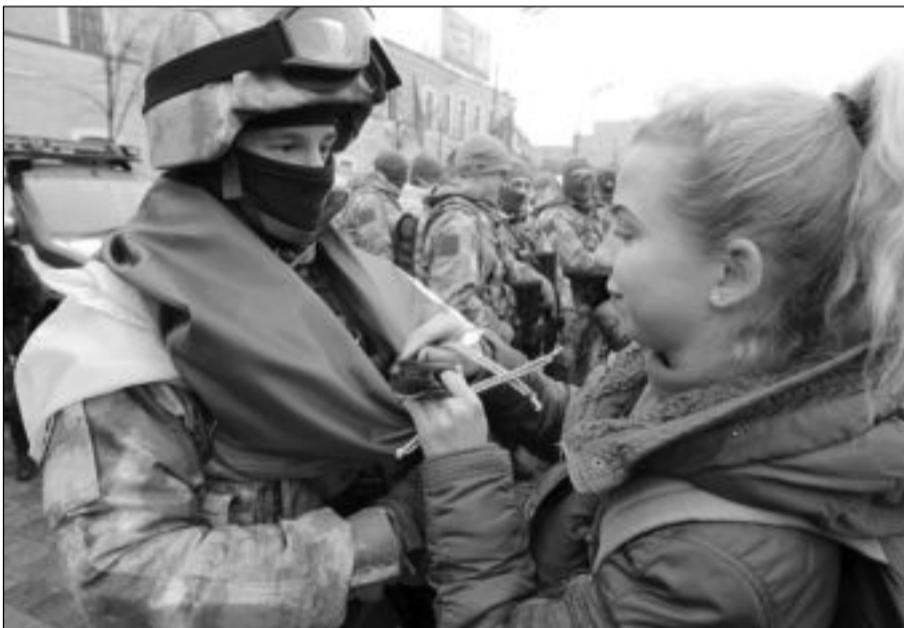
فتاة تودّع جندياً من القوات الخاصة الأوكرانية قبيل توجهه بمهمة إلى خاركيف