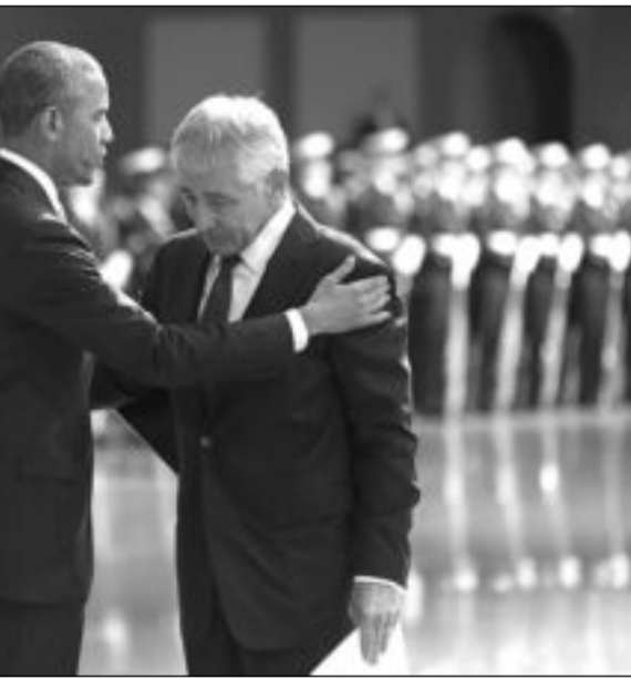
الرئيس باراك أوباما خلال حفل وداغ أقيم لهيغل في قاعدة مايبور هندرسون العسكرية في فيرجينيا

«طالبان - أفغانستان» الذين أفرج عنهم في الربيع من «غوانتانامو»، مقابل إطلاق جندي اميركي كان محتجزا في أفغانستان، حاول استئناف الاتصالات مع الحركة. وأوضح الناطق باسم الوزارة، جون كيربي، إن