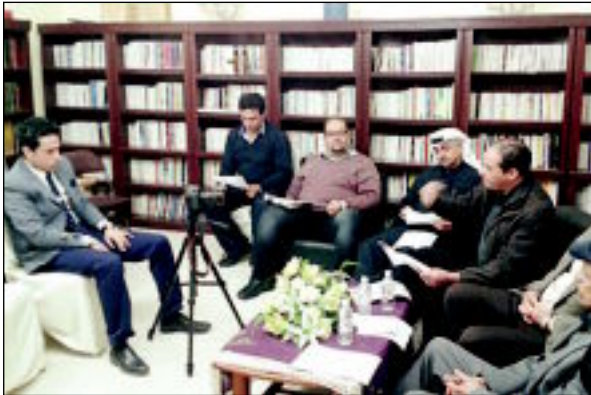
جانب من التذرة