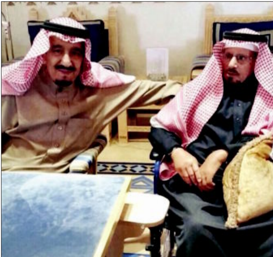
الملك سلمان ومحمد الخس المطيري

ملوك المملكة، وهذا ما جعله صاحب بعد نظر وحسم في قراراته، ولعل هذا الأمر تجسد بقراراته الأولى حيث أمر بتعيين الأمير مقرن بن عبدالعزيز ولياً للعهد، وتعيين الأمير محمد بن نايف ولياً لولي العهد ووزير الداخلية وتعيين الأمير محمد بن سلمان وزيراً للدفاع.