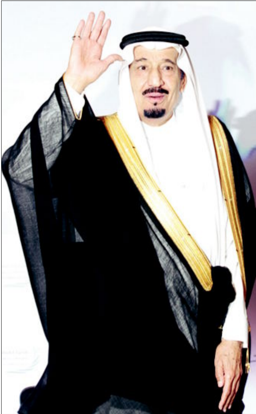
الملك سلمان بن عبدالعزيز