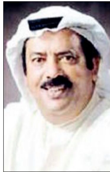
الرحوم خالد المرزوق

أبرزها دوره خلال الغزو العراقي الغاشم على الكويت العام 1990 مع الكويتيين الذين احتواهم في قلبه قبل أن يحتوهم الوطن الكبير. هكذا كانت العلاقة بين الملك سلمان والكويتيين، تزداد متانة بقدمها ورسوخها، وستبقى دائماً متوجهة ومفتوحة على مزيد من التواصل والترابط والعمق لتسكن في الوجدان وتزهو في أبهى صورة. وفي مايلي مانقله الزميل محمد العفتان عن الشخصيات الكويتية الذين التقاهم ليتحدثوا عن علاقتهم مع الملك سلمان بكثير من الحب والاعتزاز.