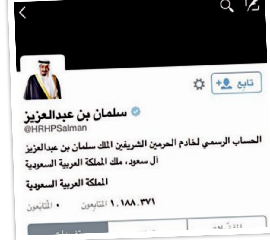
حساب الملك سلمان على «تويتر»

والذي مميزة بالملك فهد بن عبدالعزيز، رحمه الله، والملك سلمان بن عبدالعزيز، أطال الله في عمره، وكانت بداية