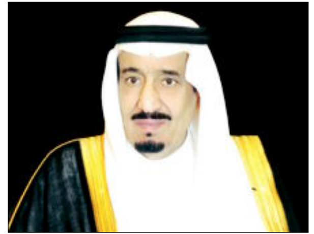
الملك سلمان بن عبد العزيز

فتح التعديل الواسع على أرفع المناصب في المملكة العربية السعودية الذي أجراه خادم الحرمين الشريفين الملك سلمان بن عبد العزيز، أمس، الطريق للجيل الشاب للعبور إلى القيادة، فعين الأمير محمد بن نايف ولياً للعهد بعدما استجاب لطلب ولي العهد الأمير مقرن بن عبد العزيز بإعفائه من المنصب، كما عين الأمير محمد بن سلمان ولياً لولي العهد، لا سيما بعد أن أظهر قدرات كبيرة منذ توليه وزارة الدفاع مطلع العام الحالي، وذلك من خلال دوره في قيادة تحالف «عاصفة الحزم» ضد الحوثيين في اليمن (تفاصيل ص 37) ويعد سمو أمير البلاد الشيخ صباح الأحمد الجابر الصباح ببرقية تهنئة إلى الملك سلمان، أعرب فيها عن خالص تهانيه بمناسبة اختياره