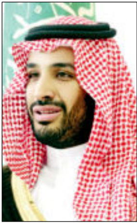
الأمير محمد بن سلمان