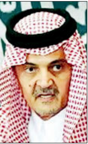
الأمير سعود الفيصل