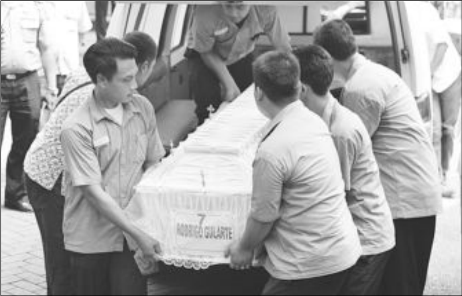
موظفو إحدى المشارج في جاكرتا يحملون نعش البرازيلي رودريغو غولارتي بعد إعدامه