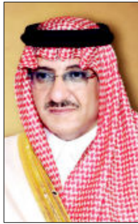
الأمير محمد بن نايف