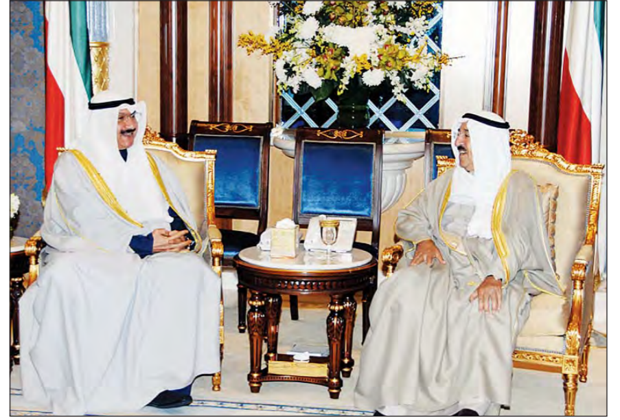
الأمير مستقبلاً سالم الصباح

كونا - استقبل سمو أمير البلاد في قصر بيان صباح أمس محافظ البنك المركزي الشيخ سالم الصباح.