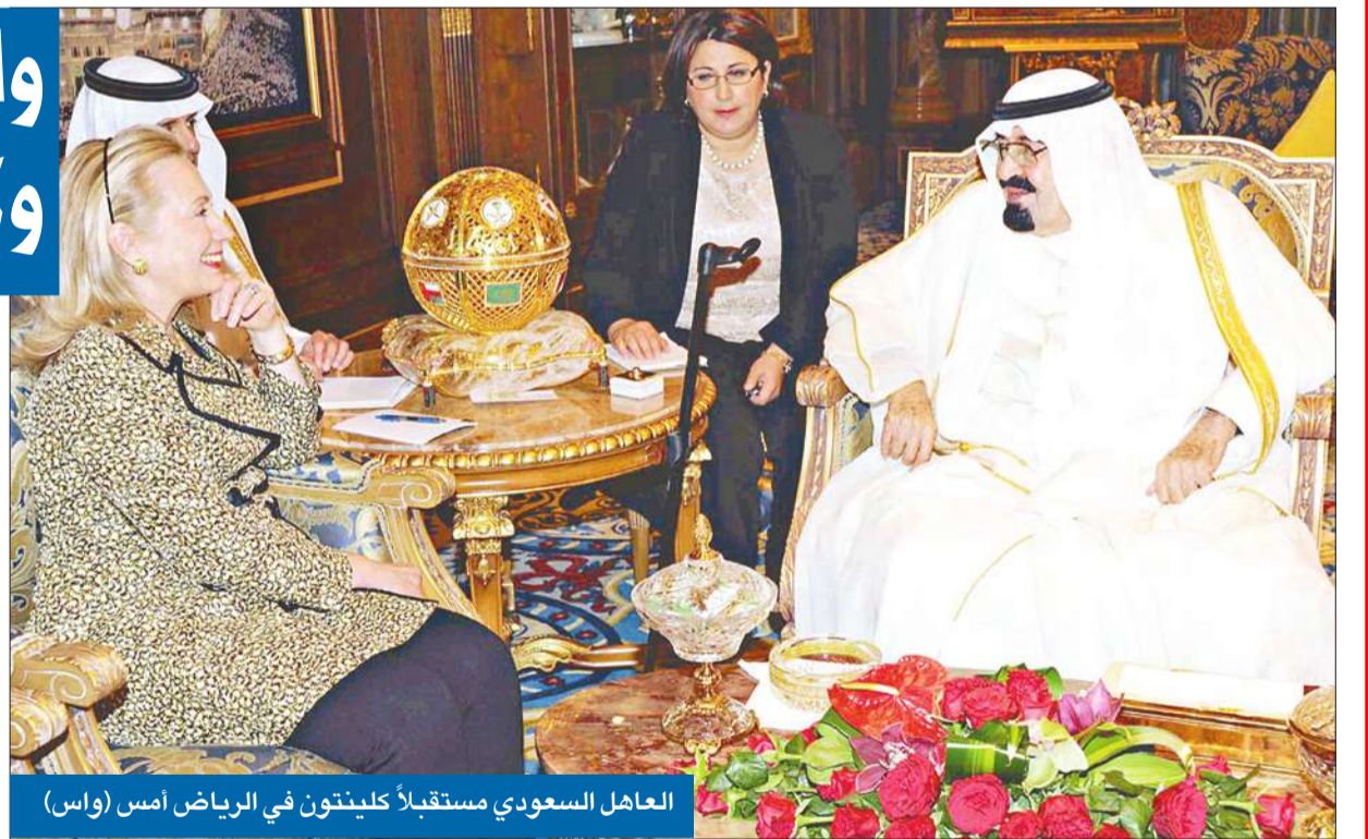
العاهل السعودي مستقبلاً كلينتون في الرياض أمس

وبينما أعلنت الولايات المتحدة أمس فرض عقوبات على وزير الدفاع السوري داود راجحة وضابطين كبيرين من حاشية الأسد هما منير