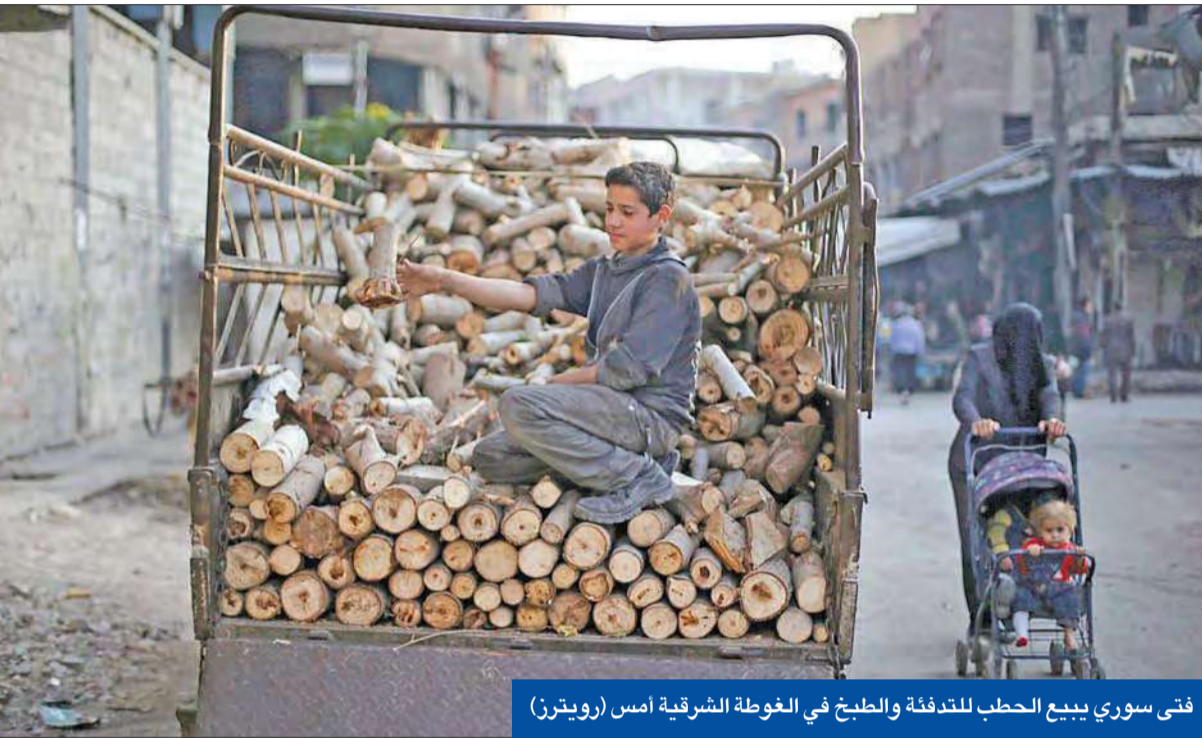
فتى سوري يبيع الحطب للتدفئة والطبخ في الغوطة الشرقية أمس

● هيغل يناقض كيري: النظام يستفيد من غارات «الائتلاف» ● ضربة جديدة لـ «خراسان» في إدلب