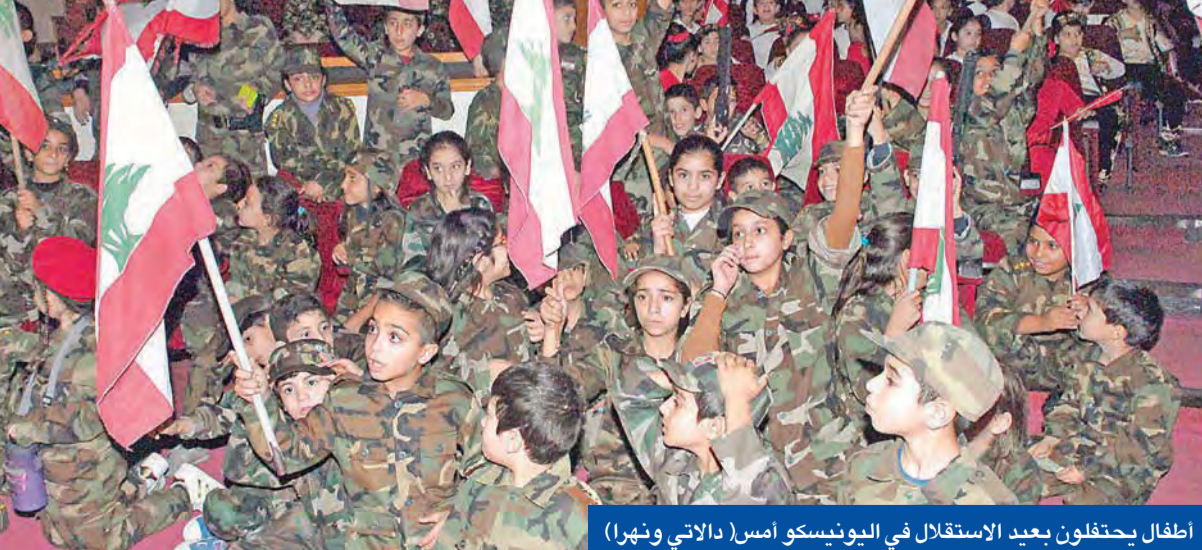
أطفال يحتفلون بعيد الاستقلال في اليونيسكو (اسر) (الاتي ونهرا)

● حلو: مستمر في ترشيحي سلام للتعامل بإيجابية مع أي انفتاح ● بيروت: ريان شربل