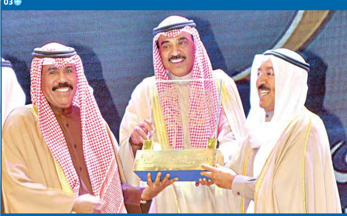
الأمير وولي العهد ويتوسطهما صباح الخالد خلال حفل اليوبيل الذهبي للصندوق الكويتي أمس