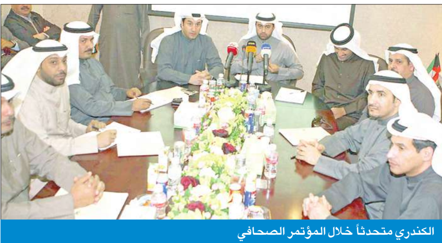
الكدري متحدثاً خلال المؤتمر الصحافي

ممثلو النقابات العالمية أكدوا أنهم سيدينون الكويت أمام منظمة العمال العالمية في جنيف