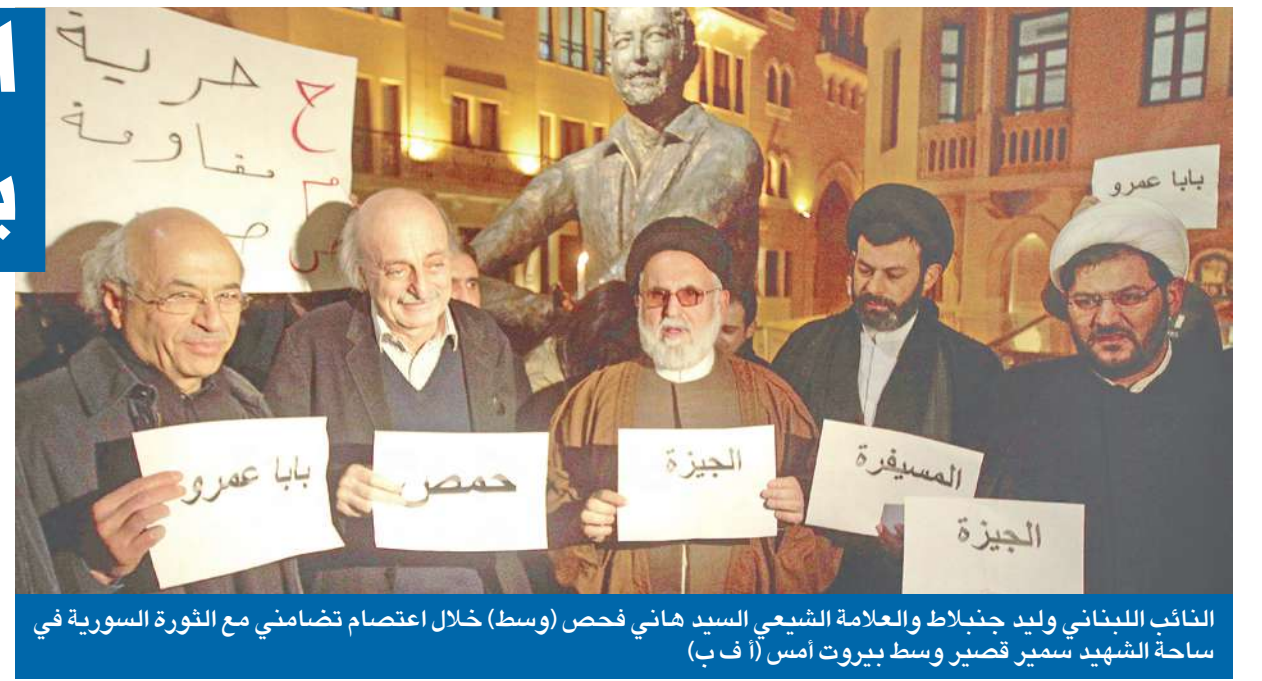
النائب اللبناني وليد جنبلاط والعلامة الشيعي السيد هاني فحس (وسط) خلال اعتصام تضامني مع الثورة السورية في ساحة الشهيد سمير قصير وسط بيروت أمس (أ ف ب)

قبل يومين من انعقاد مؤتمر «أصدقاء سورية» في تونس، أبلغ العاهل السعودي الملك عبدالله بن عبدالعزيز الرئيس الروسي ديمتري ميدفيديف أن أي حوار بشأن ما يجري في سورية لن يجدي في الوقت الراهن. وانتقد استخدام موسكو حق النقض (الفيتو) في مجلس الأمن لمنع صدور قرار بشأن سورية أوائل فبراير الجاري. وذكرت وكالة الأنباء السعودية الرسمية (واس) أن «الملك عبدالله تلقى اليوم الأربعاء (أمس) اتصالاً هاتفياً من الرئيس الروسي ميدفيديف استعرضا خلاله العلاقات الثنائية بين البلدين والأوضاع في المنطقة، وخاصة ما يجري في سورية». وأضافت الوكالة أن «الرئيس الروسي أبدى وجهة نظر