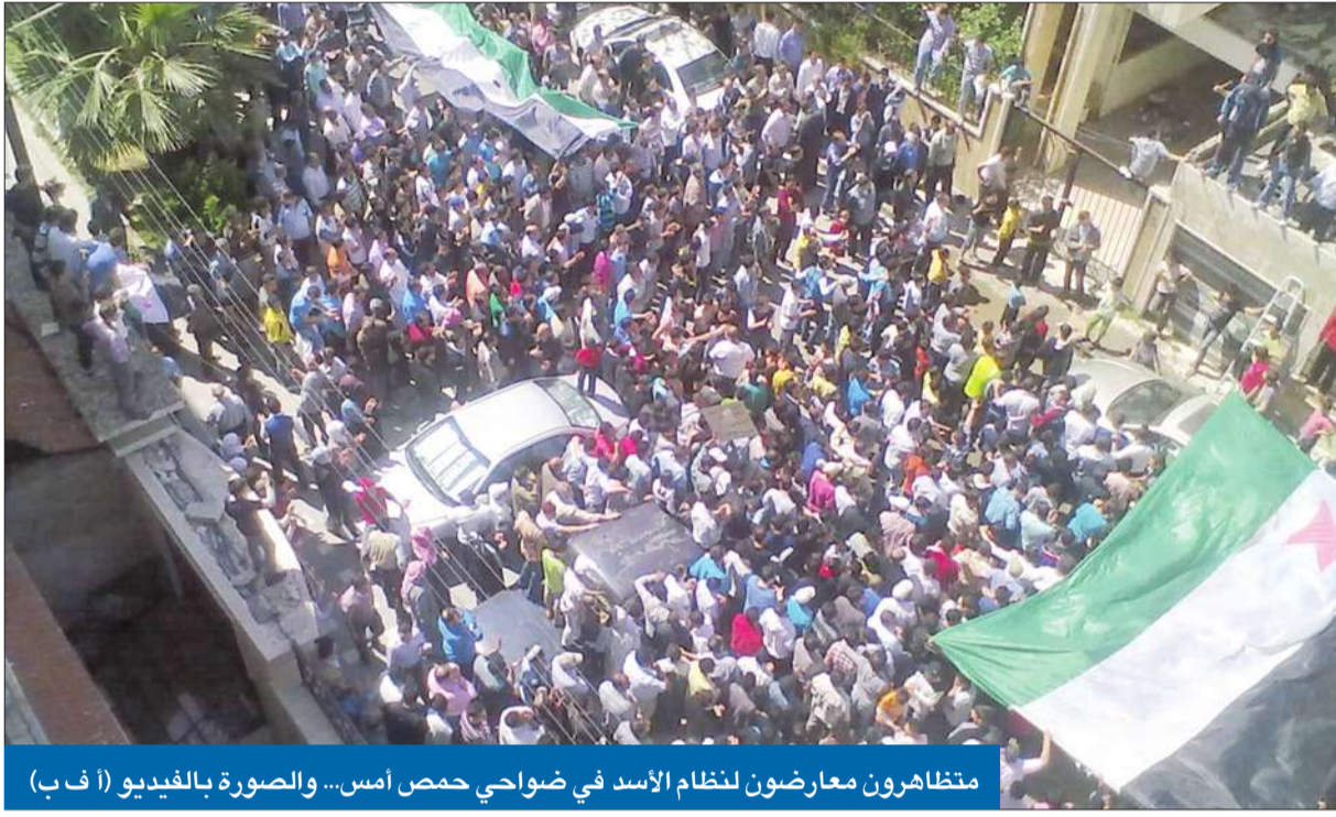
متظاهرون معارضون لنظام الأسد في ضواحي حمص أمس... والصورة بالفيديو

● تظاهرات حاشدة في مختلف المحافظات السورية ● الملك عبدالله وأردوغان يناقشان التطورات