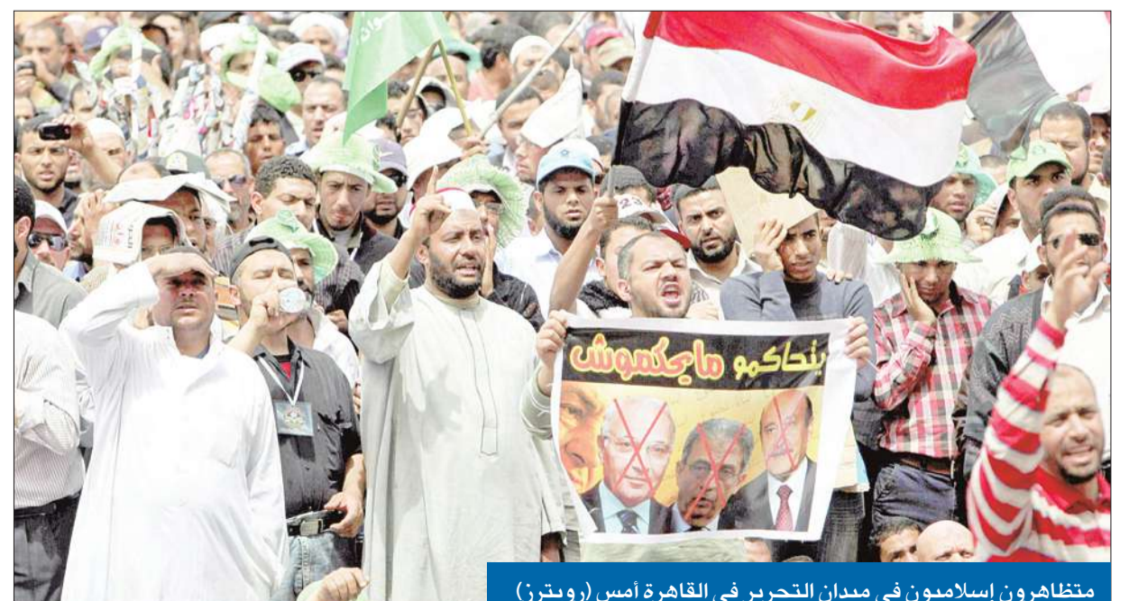
متظاهرون إسلاميون في ميدان التحرير في القاهرة أمس

القاهرة وميادين أخرى في المحافظات، للمطالبة باستبعاد «فلول» النظام السابق من الترشح للرئاسة. وتأتي هذه التظاهرات قبيل ساعات من إصدار اللجنة العليا للانتخابات الرئاسية القائمة شبه النهائية للمرشحين اليوم، وسط 02