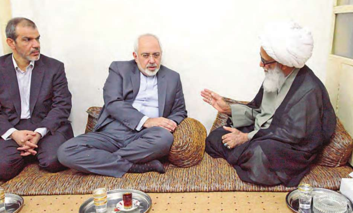
ظريف خلال لقائه بالمرجع الديني بشير النجفي والسفير الإيراني لدى بغداد حسن دنائي في النجف أمس

في أول مؤتمر صحافي له، أعرب رئيس الوزراء العراقي المكلف حيدر العبادي عن تفاؤله بتشكيل حكومة جديدة، متعهداً بحصر السلاح في يد الدولة، ومجدداً التزامه بحل الخلافات مع إقليم كردستان، وبناء علاقات جديدة مع دول الخليج.