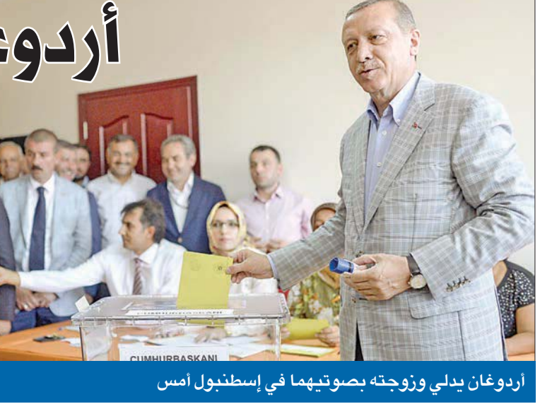
أردوغان يبدلي وزوجته بصوتيهما في إسطنبول أمس