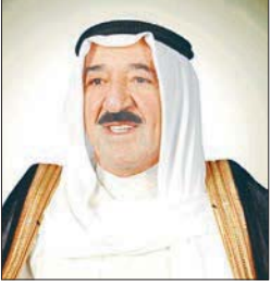
الأمير يعزي روحاني في ضحايا تحطم الطائرة الإيرانية