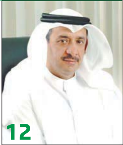
«إيليت براندر» التابعة لـ «الحميض» تمثل «إيلي وايتس» بالشرق الأوسط