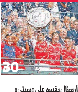
أرستال يقسو على «سيتي» ويحزق لقب الدرغ الخيرية