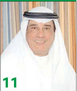
«التجارية» تؤسس شركة للتطوير العقاري في البحرين