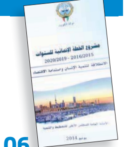
استراتيجية وطنية شاملة للزراعة والشقافية ومكافحة الفساد... وألية جديدة لتعيين قيادات الدولة