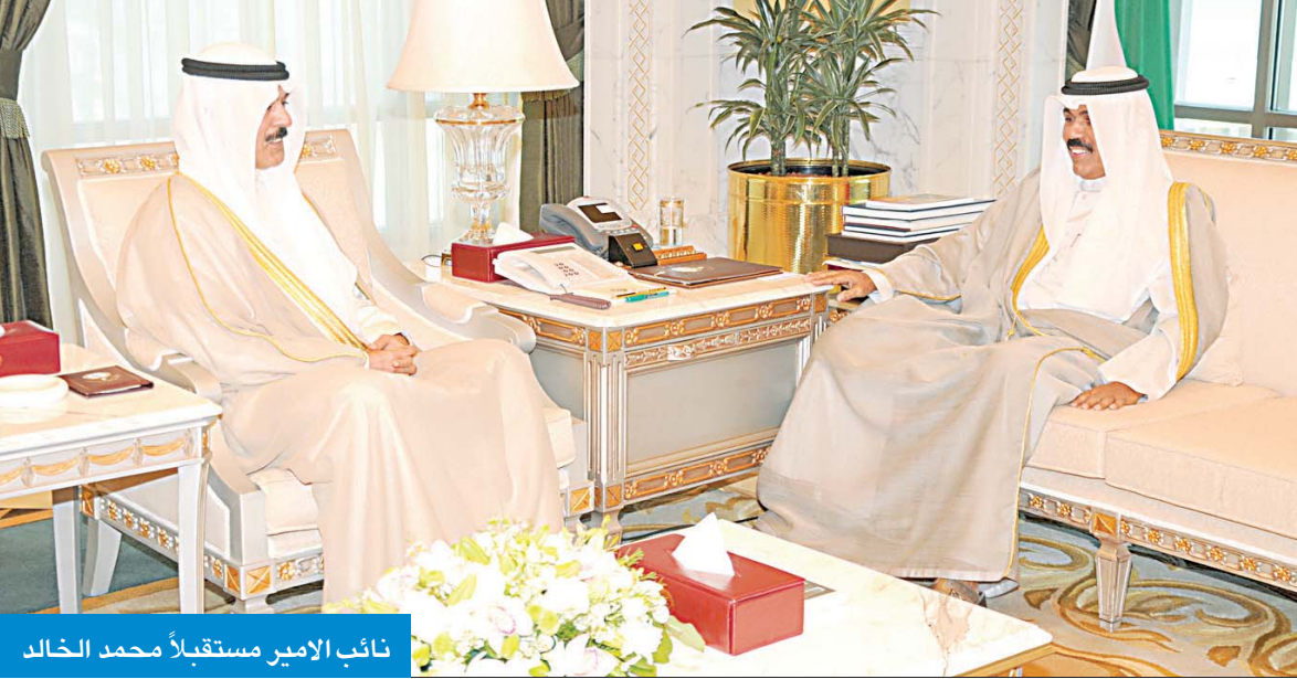
نائب الأمير مستقبلاً محمد الخالد

استقبل سمو نائب الأمير ولي العهد الشيخ نواف الأحمد في ديوانه بقصر السفن صباح أمس، رئيس مجلس الأمة مرزوق الغانم، واستقبل سموه كذلك رئيس مجلس الوزراء بالإنابة وزير الخارجية الشيخ صباح الخالد، ثم نائب رئيس مجلس الوزراء وزير الداخلية وزير الأوقاف والشؤون الإسلامية بالوكالة الشيخ محمد الخالد.