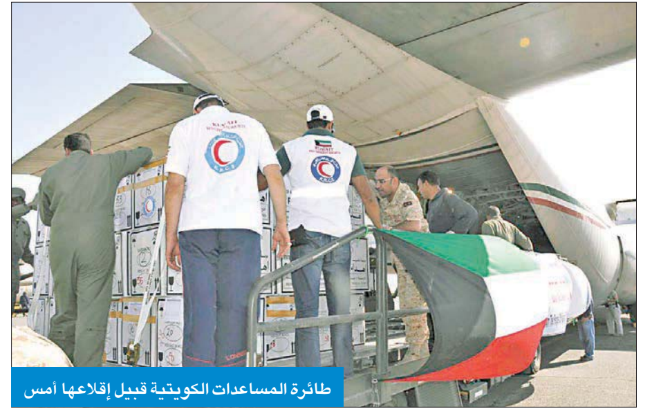
طائرة المساعدات الكويتية قبيل إقلاعها أمس

تحمل 10 أطنان من المواد الطبية لتلبية الاحتياجات العاجلة