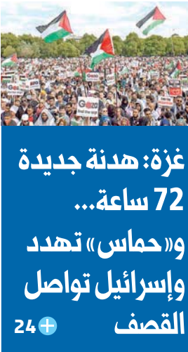
غزة: هدنة جديدة 72 ساعة... و«حماس» تهدد وإسرائيل تواصل القصف

استقبال العاهل السعودي الملك عبدالله بن عبدالعزيز أمس في مدينة جدة الرئيس المصري عبدالفتاح السيسي، في لقاء مهم تركز حول التطورات السياسية الإقليمية وتحديات الأمن القومي العربي. وبينما اعتبرت القاهرة توقيت القمة المصرية - السعودية غاية في الأهمية،