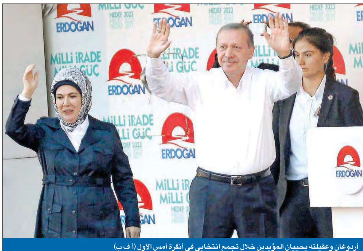
أردوغان وعقيلته يحييان المؤيدين خلال تجمع انتخابي في أنقرة أمس الأول

استبق رئيس الوزراء التركي رجب طيب أردوغان انطلاقاً مناراتون الانتخابات الرئاسية، التي حشد لها منافسه أمس كل طاقتهما لاستقطاب المزيد من المؤيدين في اليوم الأخير من الحملات الانتخابية، بالتلميح إلى تغيير النظام المعمول به في تركيا من برلماني إلى رئاسي. وتشهد تركيا اليوم انتخابات رئاسية تاريخية يتم التصويت فيها للمرة الأولى بالاقتراع المباشر لولاية من 5 سنوات، وليس من خلال البرلمان كما كان جارياً منذ تأسيس الجمهورية في عام 1923. ويتنافس في هذا الاستحقاق ثلاثة مرشحين هم، إضافة إلى أردوغان مرشح حزب العدالة والتنمية الحاكم، أكمل الدين إحسان أوغلو الأمين العام لمنظمة التعاون الإسلامي السابق، المرشح الخواقي لحزبي الشعب الجمهوري والحركة القومية المعارضين، وصلاح الدين دميرطاش مرشح حزب الشعب الديمقراطي المعارض، والمعروف أن معظم أعضائه من الكرد.