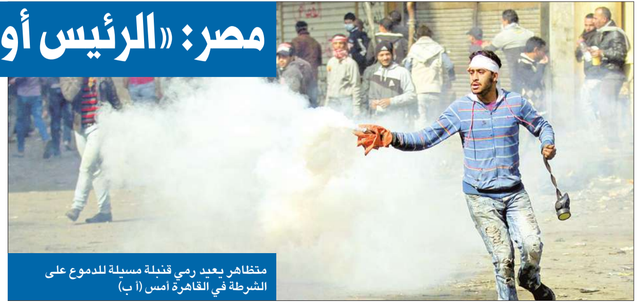
متظاهر بعد رمي قنبلة مسيلة للدموع على الشرطة في القاهرة أمس

الاجتماع لبحث قضية التعاون والتنسيق وعدد من القضايا المطروحة على الساحة. واعتبر السلطان، في تصريح آخر، أن المشهد السياسي في الأيام القليلة المقبلة «ستسطر صفحاته بطريقة غير مسبوقة في التاريخ السياسي الكويتي، وستستهل بمعركة انتخابات رئاسية مجلس الأمة». من جهة أخرى، أشادت جمعية الشفافية الكويتية بعملية انتخابات مجلس الأمة 2012. ورأى