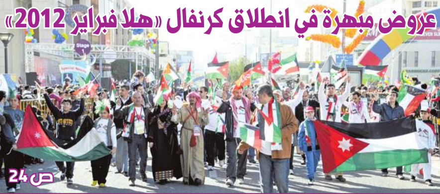
عروض مبهرة في انطلاق كرنفال «هلا فبراير 2012» ص 24