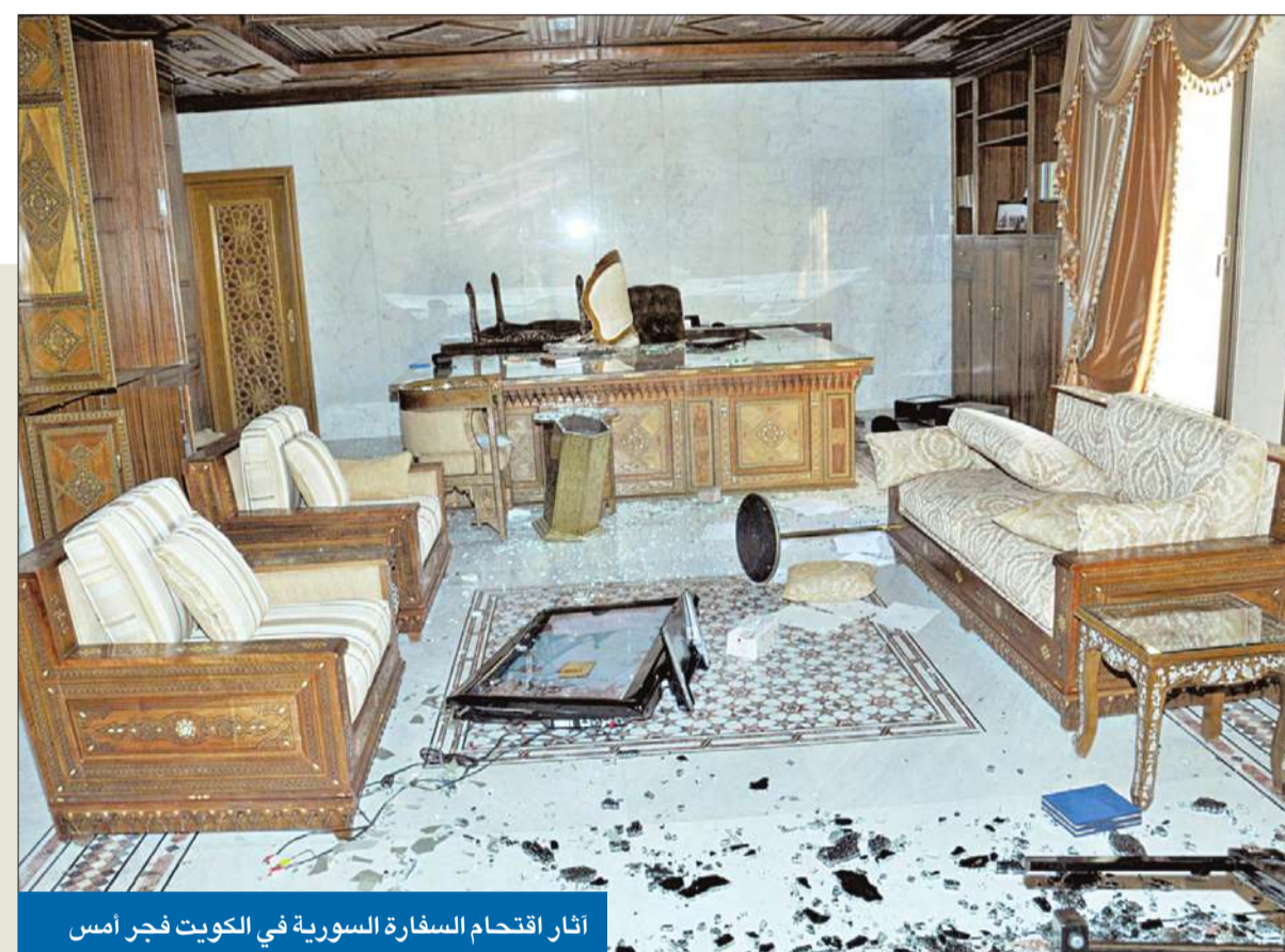
أثار اقتحام السفارة السورية في الكويت فجر أمس