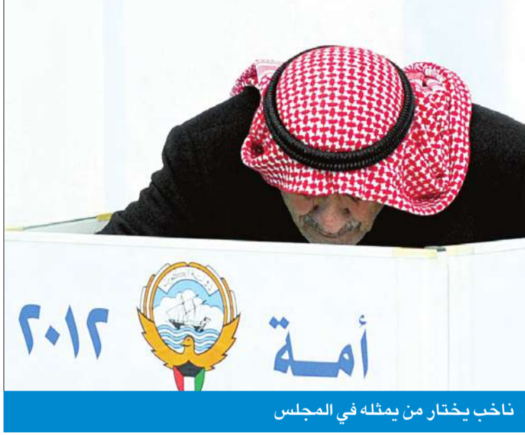
نائب يختار من يمثلته في المجلس