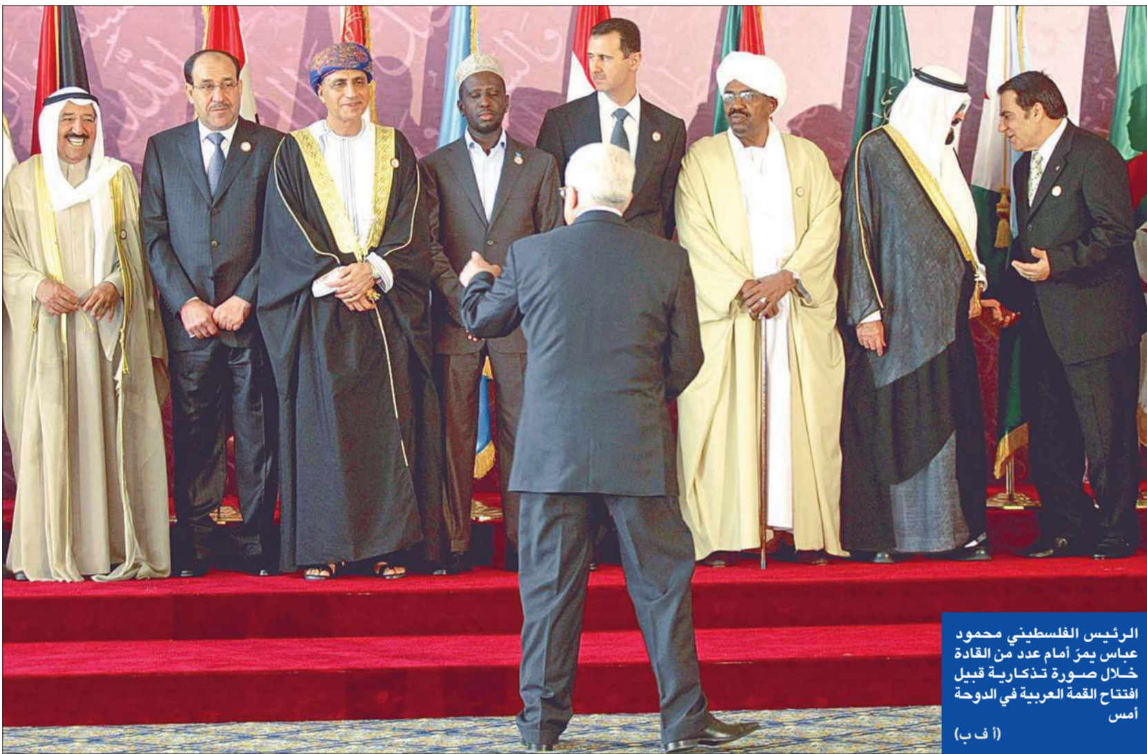
الرئيس الفلسطيني محمود عباس يمز أمام عدد من القادة خلال صورة تذكارية قبل افتتاح القمة العربية في الدوحة أمس

العادل كما حددته المبادرة العربية وقرارات الشرعية الدولية». واقترح أن يقوم العرب بعد هذه القمة بتحركات واتصالات مع اطراف اللجنة الرباعية، وخاصة مع إدارة الرئيس الأميركي باراك أوباما التي أكدت سعيها الجدي والعمل في التعاطي مع قضايا المنطقة، بهدف مطالبة هذه الأطراف باتخاذ موقف محدد لإلزام إسرائيل بالانصياع لخيار السلام العادل، وللتوضيح بأن أي تردد أو تكؤ في اتخاذ موقف مثل هذا، يعني إنكفاء لتيار التوتّر، وتدميراً لما تبقى من أمل في صناعة السلام، ولوضع البات تنفيذ وجدول زمنية لمبادرة السلام العربية.