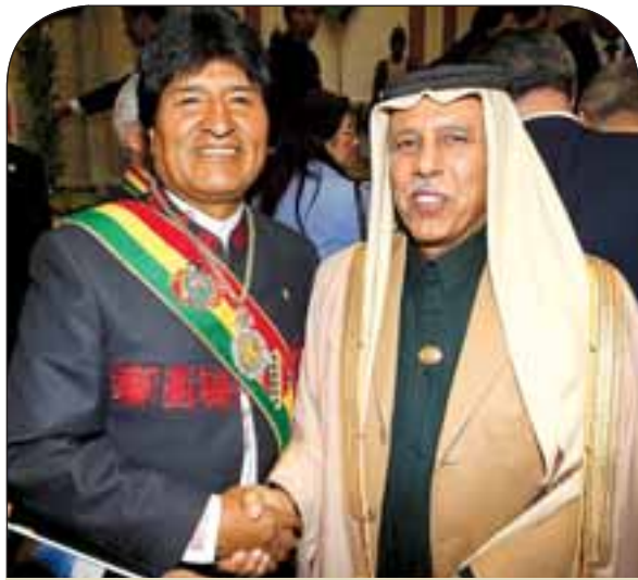
الرئيس إيفو موراليس يرحب بنائب رئيس الوزراء

الرائحة الكبري بوسع رحمته ومغفرته ويسكنه فسيح جناته، وأن ينزله منازل الصديقين والأبرار ويجزيه خير الجزاء عما قدم لوطنه وأمهته، وأن يلهم الأسرة المالكة الكريمة والشعب السعودي الشقيق والأمتين العربية والإسلامية الصبر والسلوان. «إنا لله وإنا إليه راجعون». وأمر حضرة صاحب السمو الشيخ تميم بن حمد آل ثاني أمير البلاد المفدى بإعلان الحداد في الدولة لمدة ثلاثة أيام.