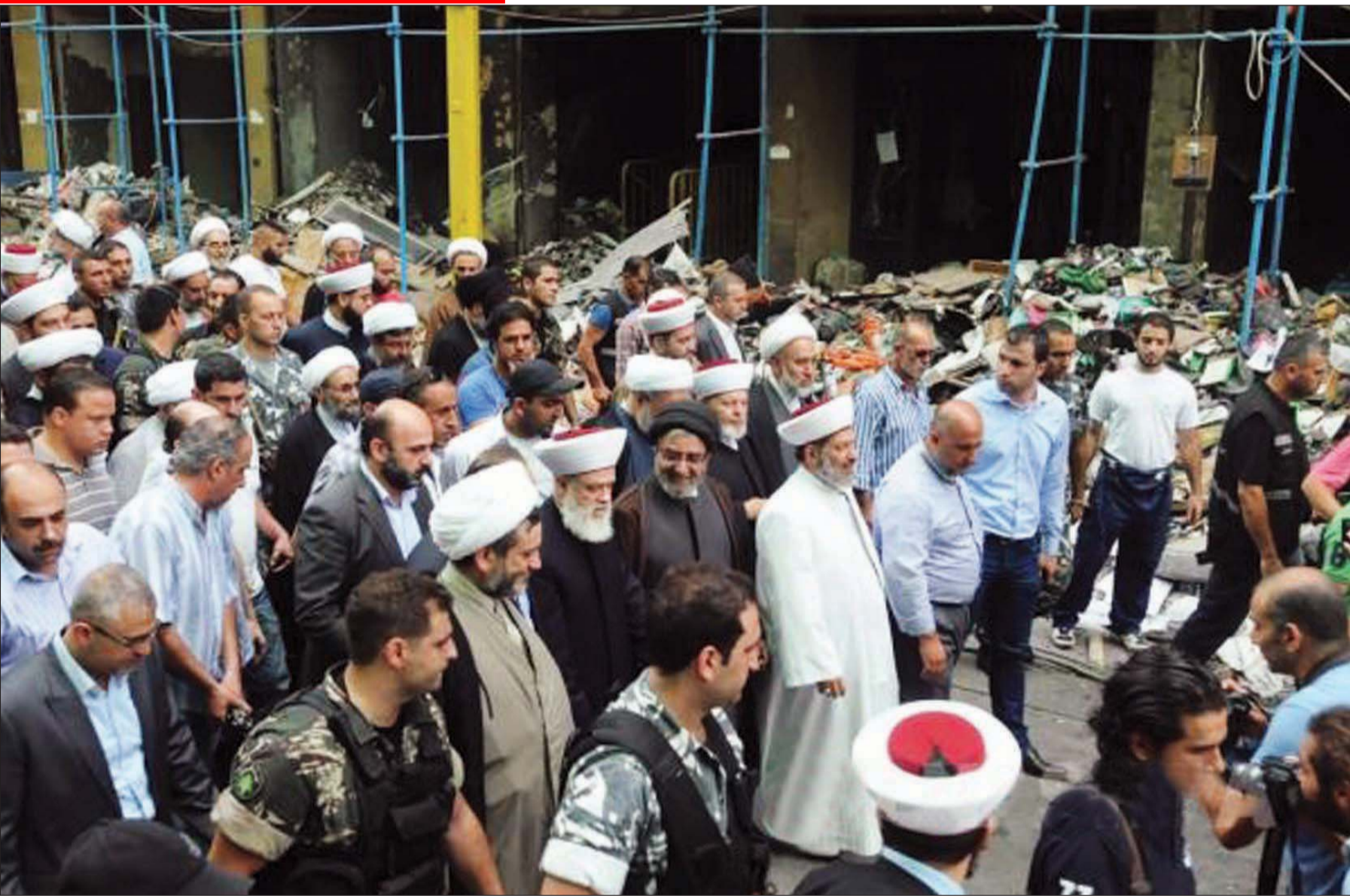
المفتي قباني يتفقد موقع التفجير في الرويس في الضاحية الجنوبية ويقدم التعازي لاهالي الضحايا

بحث المجلس الاعلى اللبناني للدفاع برئاسة الرئيس ميشال سليمان السبل الكفيلة بوضع حد للعمليات التفجيرية التي تهدف الى زعزعة السلم الاهلي والامن. وقال الامين العام للمجلس اللواء محمد الخيري في بيان تلاه عقب الاجتماع ان «المجلس بحث في تنقل العملية التفجيرية من منطقة الى اخرى بهدف زعزعة السلم الاهلي والامن» مشيداً بالروح الوطنية التي ميزت ردات فعل المواطنين بعد الانفجارين في طرابلس. وأوضح انه تم «التداول في التدابير من اجل رفع جهوزية القوى الامنية»، منها بالروح الوطنية التي تجنب لبنان الفنعة بعد الحوادث الاخيرة. وحضر الاجتماع رئيس الوزراء في حكومة تصريف الاعمال نجيب ميقاتي ووزراء المالية والدفاع الوطني والخارجية والداخلية والاقتصاد والتجارة والشؤون الاجتماعية والصحة، إضافة الى عدد من القيادات العسكرية والامنية.