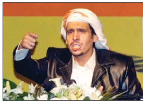
الشاعر القطري المعارض محمد العجمي

لندن - ميدل ايست أونلاين . دشن ناشطون حملة لإطلاق سراح المعارض والشاعر القطري محمد العجمي المشهور بـ«ابن الذيب» والمحكوم بالسجن 15 عاماً بسبب ما اعتبرته قطر إساءة إلى أميرها ونظام الحكم فيها. وحكمت محكمة في قطر أواخر نوفمبر، بالسجن المؤبد على «ابن الذيب» بتهمة انتقاد أمير قطر والدعوة إلى التمرد في حكم أثار غضب جماعات حقوق الإنسان، التي انتقدت خصوصاً التناقض في الخطاب السياسي القطري بين دعم المحتجين في دول عربية على إسقاط انظمتهم وعدم القدرة على تحمل أبيات شعر.