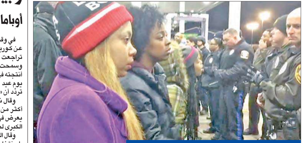
لقطة من فيديو لساكن محللين يتجادلون مع رجال الشرطة في موقع إطلاق النار امس في بيركلي

في وقت دخلت فيه مشاكل انقطاع خدمة الإنترنت عن كوريا الشمالية يومها الثالث على التوالي، تتراجع شركة «سوني بيكتشرز» عن قرار سابق لها وسحبت بعض فيلم «المقابلة» (ذي إنترفيو) الذي أنتجته في عدد من دور السينما في الولايات المتحدة يوم عيد الميلاد، كما كان مقرراً رغم التهديدات التي تردت أن «يونغ يانغ» تنفق خلفها. وقال ناطق باسم الشركة، إن الفيلم سيعرض «في أكثر من مئتي صالة»، بينما كان من المفترض أن يعرض في 2500 صالة، لو وُزع على الشبكات الوطنية الكبرى لصالات العرض. وقال المدير العام لـ«سوني بيكتشرز» مايكل ليتنوتون: «لم نخلع عن فكرة توزيع الفيلم ونحن سعداء بعرضه للمرة الأولى (...). يوم عيد الميلاد،» مضيفاً «سنواصل في الوقت نفسه جهودنا لتأمين منصات للتوزيع عبر الإنترنت»، وسيعرض في مزيد من الصالات. وتضمنت «سوني» بعض الفيلم الكوميدي، الذي يتضمن مؤامرة وهمية لاغتال زعيم كوريا الشمالية كيم جونج أون ترحيباً واسعاً من قبل الأوساط الفنية والسياسية بالولايات المتحدة أمس، بعد أن تسبب قرار سابق لشركة بالامتناع عن عرضه عقب تعرضها لهجوم إلكتروني، الأسبوع الماضي، تضمنت تسريبات لأفلام لم تعرض ومعلومات عن 47 ألفاً من العاملين