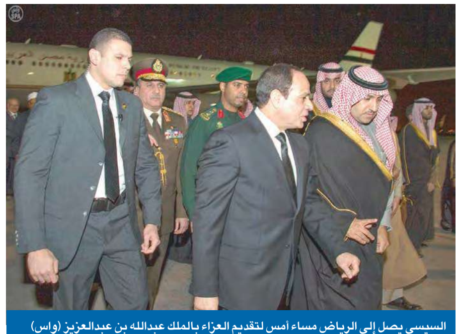
السياسي يصل إلى الرياض مساء أمس لتقديم العزاء بالملك عبدالله بن عبدالعزيز

واستقبلت الرياض أيضاً رئيس وزراء النمسا فيرنر فايمر، ورئيس وزراء المجر فيكتور أوربان، وولي عهد النرويج هاكون ماغنوس، ونائب الرئيس الهندي محمد حامد أنصاري، ونائب رئيس مجلس الوزراء الصيني يانغ جيه، ونائب رئيس