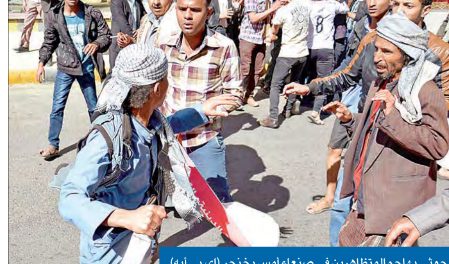
حوثي يهاجم المتظاهرين في صنعاء أمس بخنجر

مقاتلون من مأرب والجوف في صنعاء لإخلاء المحاصرين