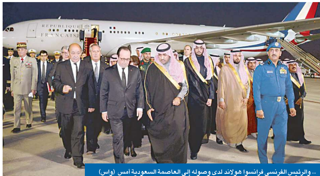
... والرئيس الفرنسي فرانسوا هولاند لدى وصوله إلى العاصمة السعودية أمس

الملك سلمان يواصل تلقي البيعة... ويستقبل أوباما بعد غد