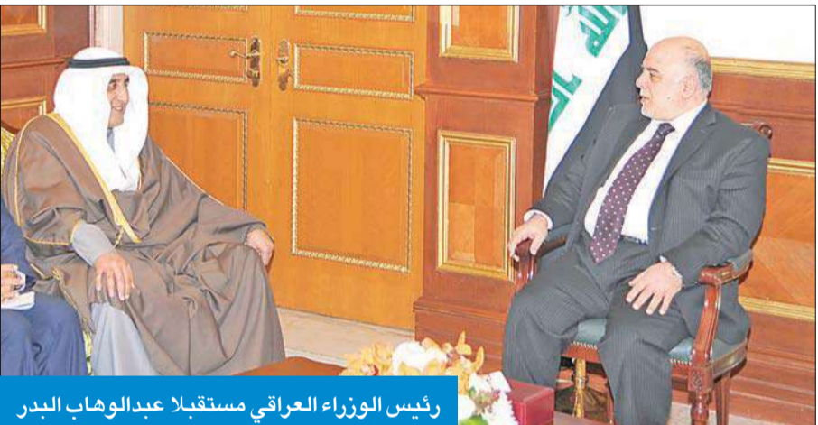
رئيس الوزراء العراقي مستقبلاً عبدالوهاب البدر

أجرى رئيس الوزراء العراقي مباحثات مع المسؤولين في البلاد، تناولت العلاقات المشتركة وجهود بغداد لتطويق الإرهاب، إضافة إلى الوضع الاقتصادي وسبل توطيد العلاقات السياسية بين البلدين.