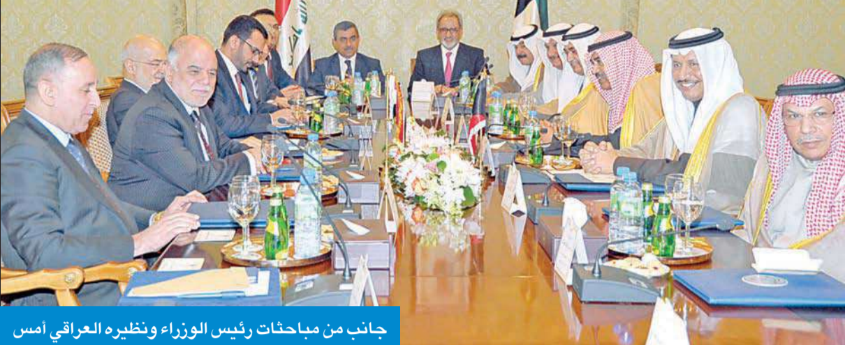
جانب من مباحثات رئيس الوزراء ونظيره العراقي أمس