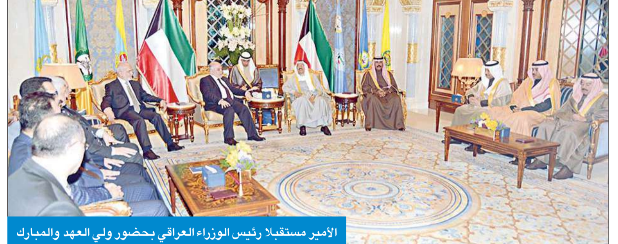
الأمير مستقبلاً رئيس الوزراء العراقي بحضور ولي العهد والمبارك