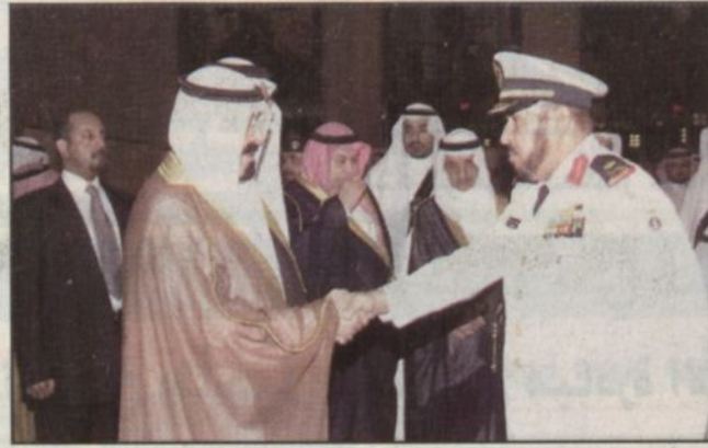
سمو ولي العهد يصل جدة (و.أس)

جدة - و.أس، ■ وجه خادم الحرمين الشريفين الملك فهد بن عبدالعزيز آل سعود شكره لمعالي وزير المالية والاقتصاد الوطني الدكتور ابراهيم العساف ولأعضاء مجلس إدارة صندوق معاشات التقاعد على ما عبروا عنه من مشاعر طيبة بمناسبة تخصيص نسبة خمسة في المئة من أسهم شركة الاتصالات السعودية لمصلحة معاشات التقاعد وما أشاروا اليه من أنه سيكون لهذا الاجراء الاثر الكبير في دعم إيرادات الصندوق وتعزيز مركزه المالي. وأكد الملك المفدى في برقية جواية لمعالي الوزير العساف حرص الدولة على توفير كل سبل الدعم الممكنة لصندوق معاشات التقاعد تمكيناً لهذه المؤسسة الحضارية في بلوغ أهدافها الكريمة. وتوجه الى الله تعالى أن يديم على المملكة أسباب الخير والامن والاستقرار.