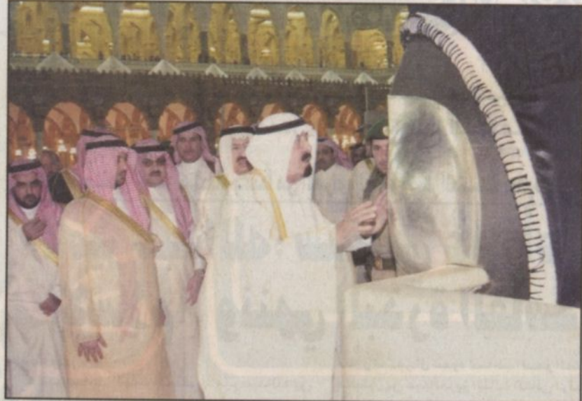
ولي العهد يطوف بالبيت العتيق