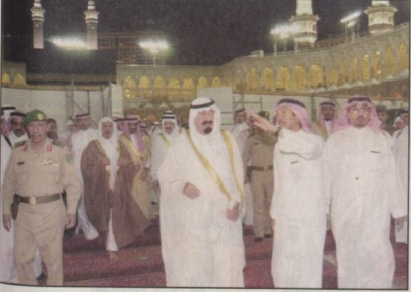
سمو يطوع على مشروع توسعة المطاف