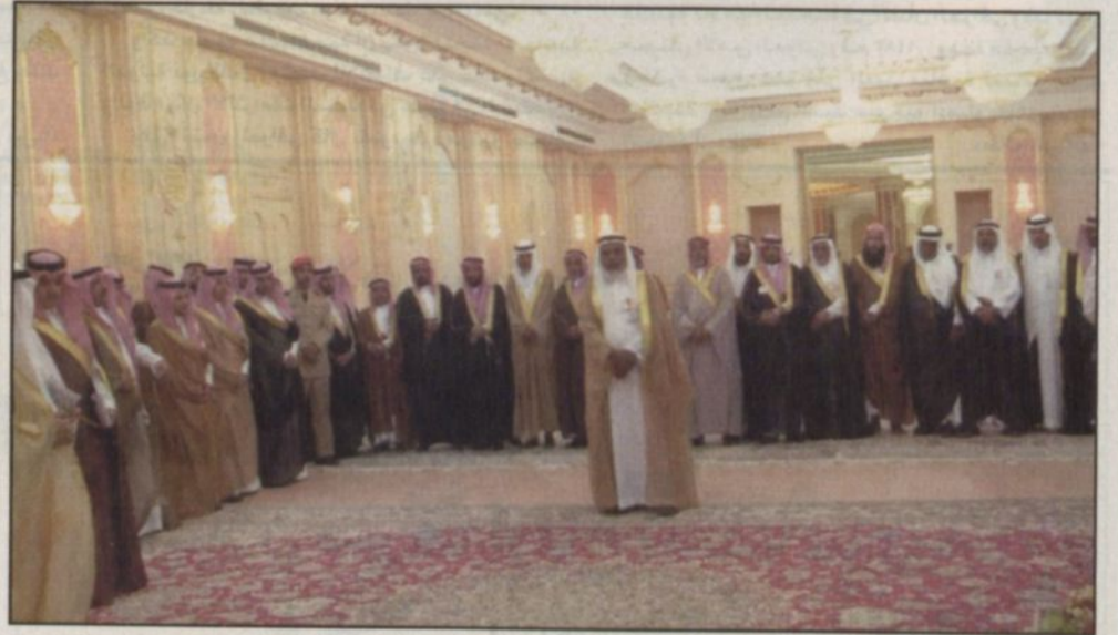
سمو ولي العهد يستقبل الامراء والمواطنين وشيوخ القبائل