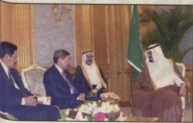
الامير عبدالله مستقبلا العمود الفلبيني (و.ا.س)

جدة- و.ا.س، تسلّم صاحب السمو الملكي الأمير عبدالله بن عبدالعزيز ولي العهد نائب رئيس مجلس الوزراء رئيس الحرس الوطني رسالتين لخادم الحرمين الشريفين الملك فهد بن عبدالعزيز آل سعود وسمو ولي العهد من فخامة الرئيسة غلوريا اربوي جمهورية الفلبين. وقام بتسليم الرسالتين لسمو ولي العهد المبعوث الخاص لفخامة رئيسة الفلبين لدول مجلس التعاون الخليجي امّا بل اقيس خلال استقبال سموه له في مكتبه بالديوان الملكي في قصر السلام امس. كما نقل المبعوث الفلبيني لصاحب السمو الملكي الأمير عبدالله بن عبدالعزيز تحيات وتقدير فخامة غلوريا اربوي فيما حمله سمو ولي العهد تحياته وتقديره لفخامتها. وحضر الاستقبال صاحب السمو الأمير الدكتور بندر بن سلمان بن محمد آل سعود المستشار في ديوان سمو ولي العهد والسفير الفلبيني لدي المملكة باهنا ريم ملا.