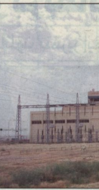
د. غازي القصيبي

التحكم ومكافحة الحريق، وقد بلغت تكاليف هذا الجزء من المشروع ٢,١١٧,٨٠٠ ريالاً. كما اشتمل المشروع على إنشاء خطوط الأنابيب التي سيتم عن طريقها نقل المياه المحلاة إلى كل من مكة المكرمة والطائف وجدة وبلغت تكاليف مشروع خط الأنابيب بالمرحلة الثانية ١,٣٩١,١٩٩,١٧٠ ريالاً. كما يشتمل المشروع على إنشاء مجمع سكني للعاملين في المشروع يتكون من ٧٠٠ فيلا و١٨٠٠ شقة عالية و١١٢٠ وحدة سكن عزاب إضافة إلى مدرسة ابتدائية، ومتوسطة، وثانوية ومسجد، وناد اجتماعي مع كامل البنى التحتية لها وبلغت تكاليف المشروع الإجمالية ١٨٣,٩٧٠,٧٥٣ ريالاً. كما اشتمل المشروع على إنشاء رصيف بحري يستطيع استقبال وتفريغ السفن حمولة مائة ألف طن.. وتبلغ أبعاد الرصيف الرئيسية ٣٢.٥ في ٣٨.٥ متراً. بالإضافة إلى عدد ٢ من المعدات أبعادها ١٢ في ١٢ متراً، وتقع منصة الرصيف البحري داخل البحر على بعد حوالي ٢٠٠ متر من الشاطئ، وترتبط باليابسة بواسطة طريق معبد وقد بلغت تكاليف المشروع الخاص بالرصيف البحري ١٢٤,١٤٤,٠٠٠ ريالاً. ويعد هذا المشروع من أهم المشاريع الخاصة بتوفير مياه الشرب المحلاة لثلاث مدن في مكة المكرمة وجدة والطائف.. بالإضافة إلى ما حولها من محافظات أخرى.. وسيساهم هذا المشروع بإذن الله في حل نسبة كبيرة من نقص مياه الشرب في هذه المدن.. وتوفير المياه النقية لجميع المواطنين حيث يعتبر المشروع والذي بدأ تنفيذ مرحلته الأولى في عام ١٤١٩هـ.. وأنتهت مرحلته الثانية في هذا العام ١٤٢٤هـ. وهو من أهم الروافد لتوفير مياه الشرب للمواطنين.. ويعتبر امتداداً لمعطيات الخبر التي تهتم بتوفير كل احتياجات ومتطلبات رفاة المواطن.