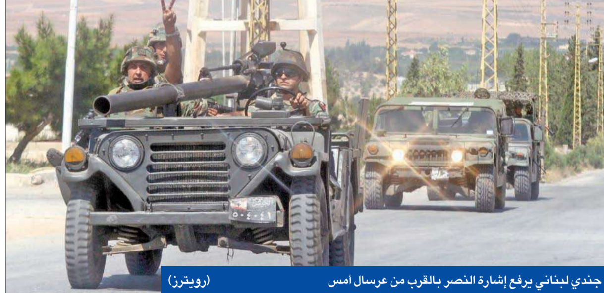
جندي لبناني يرفع إشارة النصر بالقرب من عرسال أمس

● وفد «هيئة العلماء» يعود للوساطة ● نشر قوات خاصة... والحريري يدعو إلى إعلان الاستنفار