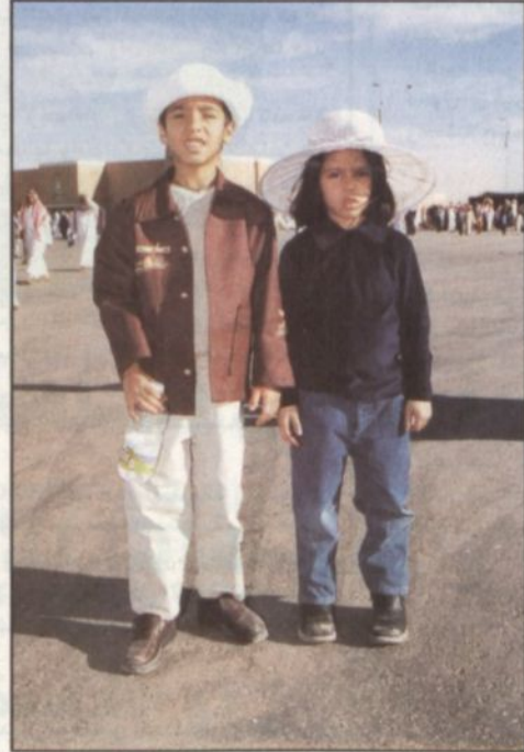
طفولة اليوم في الجنادرية

■ الجنادرية.. عرس موسمي يحرض الصغار قبل الكبار على حضوره.. والآباء يجدونها فرصة ليجعلوا الأبناء يعيشون لحظات مع الحياة السابقة.. في ملامسة للواقع الماضي والواقع الحاضر. والاطمئنان لا شك سيترك اثره البالغ في نفوس البراعم لتبقى الذكرى مع الوطن مستديمة.