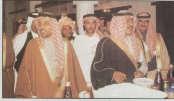
الأمير مقرن في مبنى المدينة

■ أوضح صاحب السمو الملكي الأمير مقرن بن عبدالعزيز أمير منطقة المدينة المنورة ان اهتمام صاحب السمو الملكي الأمير عبدالله بن عبدالعزيز ولي العهد - حفظه الله - بالتراث الوطني يدل على اطلاع ابنائنا على ما كان عليه الآباء والاجداد.