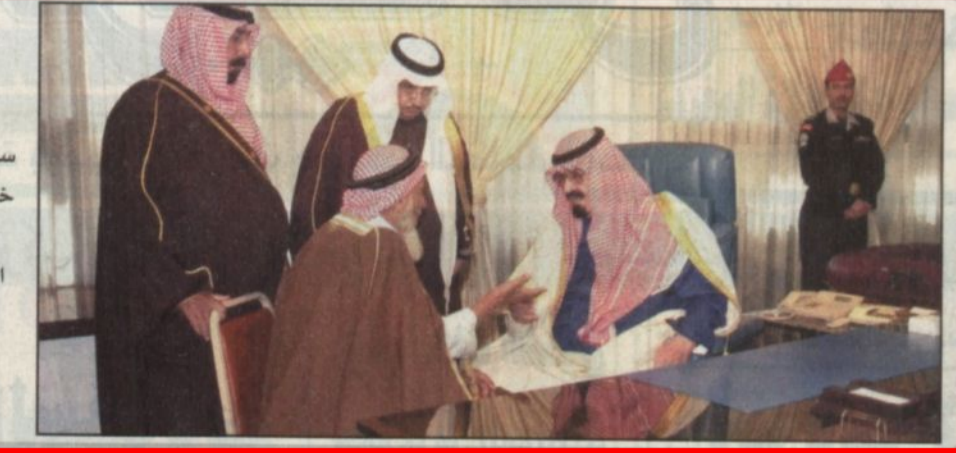
سمو ولي العهد خلال استقباله المواطنين