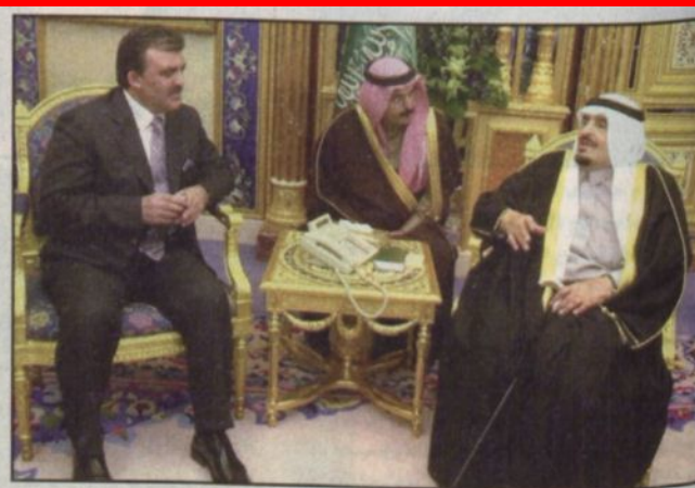
الأمير عبدالله خلال اجتماعه مع ولي العهد غول (واس)