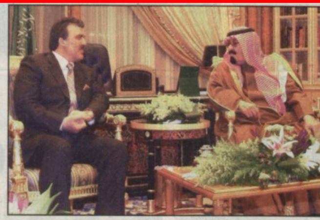
الأمير عبدالله خلال اجتماعه مع رئيس وزراء تركيا (واس)

الرياض - محمد الأمير، واس: أنقرة - كمال حوجة، استقبال خادم الحرمين الشريفين الملك فهد بن عبدالعزيز آل سعود حفظه الله في مكتبه بقصر اليمامة أمس دولة رئيس وزراء الجمهورية التركية عبدالله غول والوفد المرافق له. وقد عقد خادم الحرمين الشريفين ودولة رئيس الوزراء التركي اجتماعاً جرى خلاله بحث مستجدات الوضع في منطقة الشرق الأوسط وخاصة القضية الفلسطينية كما استعرض الجانبان الأوضاع على الساحتين الإسلامية والدولية إضافة إلى بحث اتفاق التعاون بين البلدين وسبل دعمها وتعزيزها في المجالات كافة. كما عقد صاحب السمو الملكي الأمير عبدالله بن عبدالعزيز وولي العهد نائب رئيس مجلس الوزراء رئيس الحرس