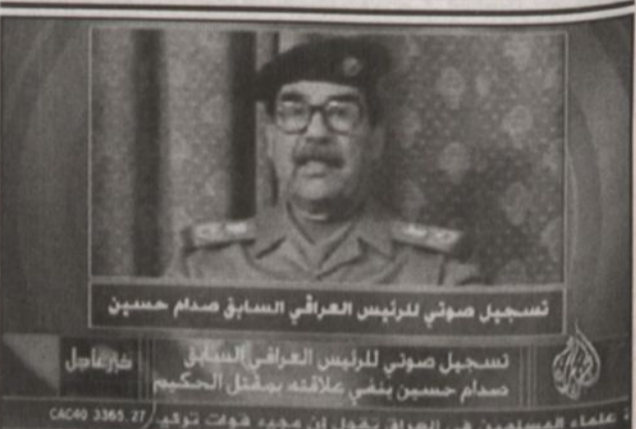
فتاة الجزيرة، تعرض لتسجيل الصوتي لصدام

البصرة - (العراق)، أ.ف.ب، أعلن متحدث باسم الجيش البريطاني شام الحلاوي ان القوات البريطانية نزعت مساء (الاحد) أسلحة نحو ١٠٠ من انصار الزعيم الرايديالي الشيعي مقتدى الصدر بعد ان اقاموا حاجزا في وسط البصرة (جنوب العراق). وقال المتحدث ان نحو ١٠٠ من انصار مقتدى الصدر اقاموا بعد الظهر حاجزا غير مشروع امام مكتبهم وراحوا