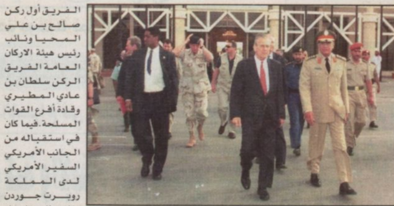
مغادرة وزير الدفاع الأمريكي (و.اس)

الرياض - واس، أقام صاحب السمو الملكي الأمير سلطان بن عبدالعزيز النائب الثاني لرئيس مجلس الوزراء وزير الدفاع والطيران والمفتش العام أمس حفل غداء تكريماً لمعالي وزير الدفاع الأمريكي دونالد رامسفيلد والوفد المرافق له.