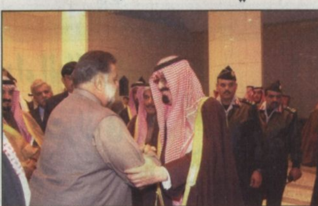
خادم الحرمين يستقبل وزير الأوقاف الجزائري