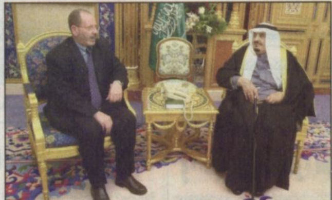
خادم الحرمين يستقبل وزير الأوقاف الجزائري (و.أ.س)

الرياض - واس - استقبل خادم الحرمين الشريفين الملك فهد بن عبدالعزيز آل سعود في مكتبه بقصر اليمامة في الرياض امس دولة رئيس وزراء باكستان مير ظفر الله جمالي والوفد المرافق له. وقد عقد خادم الحرمين الشريفين اجتماعاً مع دولة رئيس وزراء باكستان الذي نقل للملك المفدى في بداية الاجتماع تحيات وتقدير فخامة الرئيس برويز مشرف رئيس جمهورية باكستان الاسلامية والتعبير بالباكستاني الشقيق.. كما حمله حفظه الله تحياته وتقديره لفخامته. وجرى خلال الاجتماع بحث تطورات الأحداث في الشرق الاوسط وخاصة القضية الفلسطينية والمستجدات على الساحتين الاسلامية والوطنية.. كذلك استعراض العلاقات بين البلدين الشقيقين وسبل دعمها وتطويرها. وحضر الاجتماع من الجانب السعودي صاحب السمو الملكي الأمير أحمد بن عبدالعزيز نائب وزير الداخلية وصاحب السمو الملكي الأمير سعود بن فهد بن عبدالعزيز نائب رئيس الاستخبارات العامة وصاحب السمو الملكي الأمير عبدالعزيز بن فهد بن عبدالعزيز وزير الدولة وعضو مجلس الوزراء ورئيس