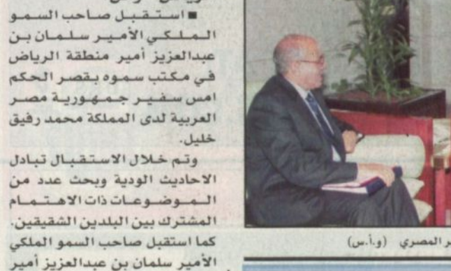
الأمير سلمان استقبال السفير المصري

الرياض - واس - استقبل صاحب السمو الملكي الأمير سلمان بن عبدالعزيز أمير منطقة الرياض امس سفير جمهورية مصر محمد مويحيى حاج مزالى. وتم خلال الاستقبال بحث عدد من الموضوعات ذات الاهتمام المشترك بين البلدين.