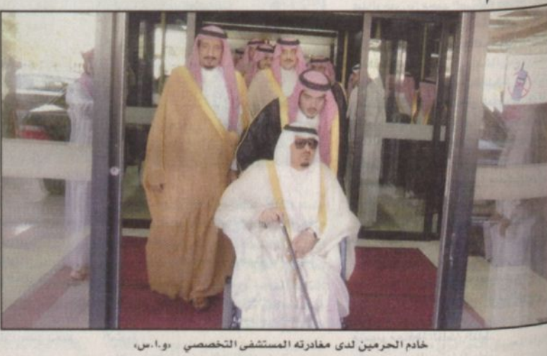
خادم الحرمين لدى مغادرته المستشفى التخصصي

الرياض - و. أ. س، أعلن بيان اصدره الديوان الملكي أن خادم الحرمين الشريفين الملك فهد بن عبدالعزيز - الله ورعاه - غادر مستشفى الملك فيصل وحفظه مستشفى الملك فيصل بالرياض بعد عصر أمس بعد اجراءه - حفظه الله - لعملية إزالة الماء الأبيض من العين اليسرى التي كللت بفضل الله وكرمه بالنجاح فله الحمد والشكر. حفظه الله ورعاه واحاطه بعين عنايته ووقاه من كل مكروه وتمتع بالصحة والعافية واهمه ببعونه وتوفيقيه.