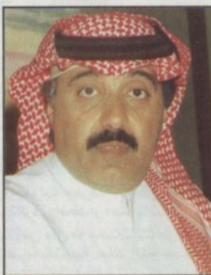
الأمير متعب بن عبدالله

■ نيابة عن صاحب السمو الملكي الأمير عبدالله بن عبدالعزيز ولي العهد نائب رئيس مجلس الوزراء رئيس الحرس الوطني افتتح صاحب السمو الملكي الشريف أول ركن متعب بن عبدالله بن عبدالعزيز نائب رئيس الحرس الوطني المساعد للشؤون العسكرية مساء يوم الخميس الموافق 11/1/1423هـ المعرض الأول للإعجاز العلمي في القرآن الكريم الذي ينظمه جهاز الإرشاد والتوجيه بالحرس الوطني ضمن فعاليات مهرجان الوطن للثقافة والتراث الثامن عشر بقاعة الملك فيصل للمؤتمرات بالرياض. وأوضح المشرف العام على المعرض سعادة الدكتور إبراهيم بن محمد أبو عياد - رئيس جهاز الإرشاد والتوجيه - بالحرس الوطني قائلاً: ان المعرض يعد الأول من نوعه في المملكة، حيث يحتوي على أكثر من (160) لوحة ومحسناً وصورة لتوضيح الإعجاز العلمي في القرآن الكريم وأبان ان المعرض يتكون من قسمين قسم للوحات العلمية القرآنية وقسم المجسمات العلمية القرآنية، حيث يحوي قسم اللوحات العلمية سبعة أقسام وهي: قسم الاستنساخ؛ وفيه لوحات علمية مع تعليقات قرآنية حول مسألة الاستنساخ ورأي العلم والدين حول هذا الموضوع. قسم الحيات والنبات؛ وفيه عرض متنوع لقدرة الله تعالى في عالم الحيوان والنبات ومعجزات القرآن الكريم المتعلقة بذلك. قسم معجزات القرآن وأسرار الصوت؛ وفيه ذكر لأحوال من وجدوا على هيئة مومياءات تحكي بصورة ناطقة عن ما أخبر به القرآن الكريم من أسرار الموت. قسم معجزات القرآن في خلق الإنسان؛ وفيه عرض مبهر لأحدث الصور العلمية حول الخطوات المعقدة لتكوين الجنين في بطن أمه وما