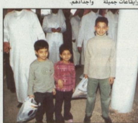
الجوائز كانت من نصيب الاطفال