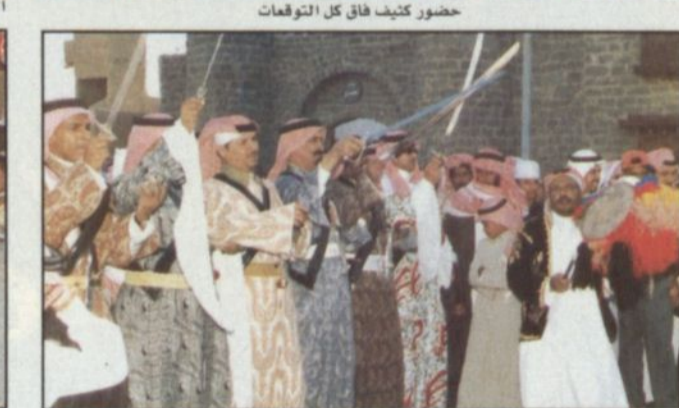
الفرق الشعبية أبدعت بعروضها