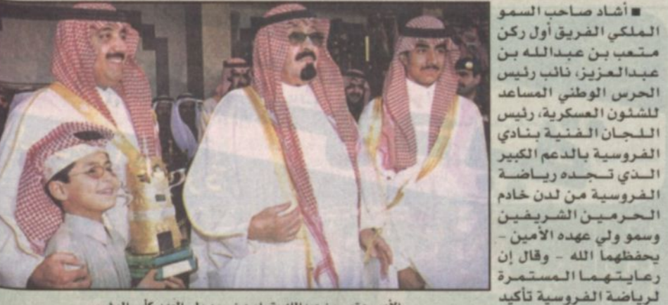
الأمير متعب بن عبدالله يتسلم من سمو ولي العهد كأس المؤسس يوم فازه (طالع الذهب) ١٤٢١ هـ.

احتفال اليوم الكبير تخليد للذكرى العظيمة لفارس التوحيد والبناء