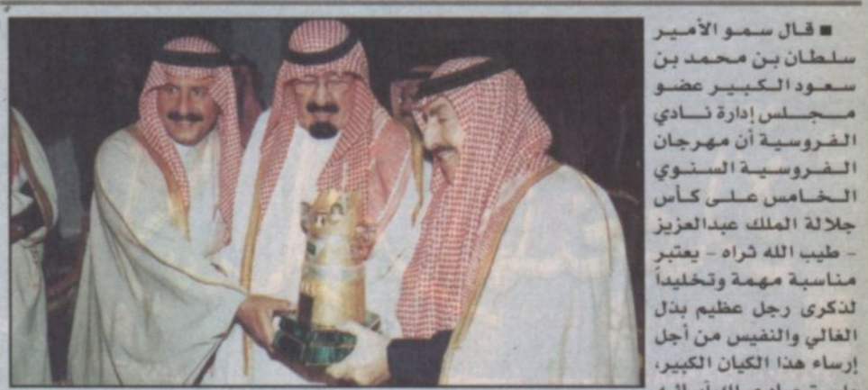
الأمير سلطان بن محمد يتسلم من سمو ولي العهد كأس المؤسس الأخير يوم كسبه المفخرة (مرخان) ١٤٢٣ هـ.

«لمح البصر» في قمة الترشيحات يليه «فضل من الله.. المدلل.. متكامل».