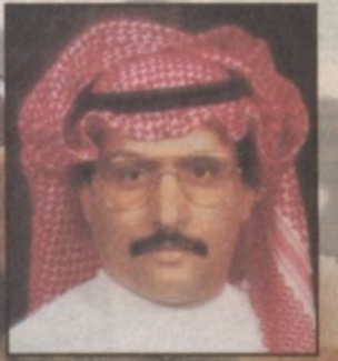
إعداد: فهد الدوس