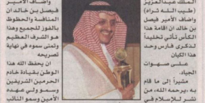
الأمير فيصل بن خالد الثاني.

جاء ذلك في تصريح أدلى به سموه بمناسبة إقامة السباق الكبير اليوم على كأس جلالة الملك عبدالعزيز (طيب الله ثراه) وأضاف الأمير فيصل بن خالد أن إقامة هذا الكأس تأتي تخليداً لتكرير فارس وحد هذا الكيان على صهوات الجياذ.