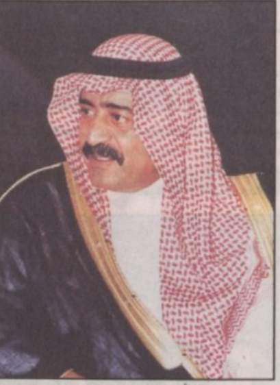
الأمير مقرن بن عبدالعزيز