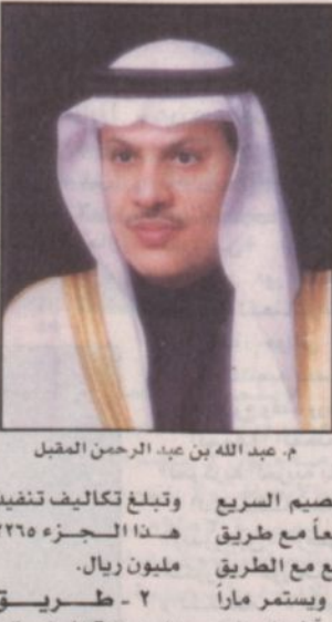
عبد الله بن عبد الرحمن المقبل

المطريق. وتبلغ تكاليف تنفيذ هذا الجزء ١٨٠٥ ملايين ريال. ٣ - طريق ينبع - رابع - طول السريع: يبلغ طول هذا الجزء ١٩٨ كيلومتراً ويبدأ من الطريق المرزوق القائم بين مدينة ينبع ومنطقة ينبع الصناعية شرق محطة تحلية المياه لينبع والمدينة المنورة وذلك على مسافة ٤٣ كيلومتراً جنوب شرق مدينة ينبع، ويستمر الطريق بعد ذلك باتجاه جنوب شرقي بمحاذاة ساحل البحر الأحمر ماراً شرق الرايس بمسافة ١٠,٥ كلم، ومسورة بمسافة ٦ كيلومترات إلى أن يلتقي بطريق جدة - المدينة المنورة السريع وذلك عند تقاطع تول الحالي.