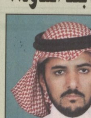
بقلم: علي بن عبدالعزيز الشري * *