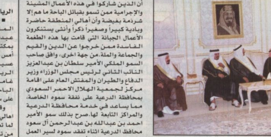
سمو النائب مستقبلاً مشايخ قبائل الباحة

الرياض - واس، استقبل صاحب السمو الملكي الأمير سلطان بن عبدالعزيز النائب الثاني لرئيس مجلس الوزراء وزير الدفاع والطيران والمفتش العام بمكتب سموه بالمعذر أمس وفداً من أهالي منطقة الباحة الذين قدموا للسلام على سموه. وقدم الوفد باسم أهالي المنطقة التهنئة بنجاح العملية الجراحية التي أجريت لخادم الحرمين الشريفين وعبروا عن استنكارهم للتفجيرات الإرهابية التي وقعت في مدينة الرياض وراح ضحيتها عدد من الأبرياء. وقد أكد سمو الأمير سلطان بن عبدالعزيز الثقة في الجميع وذكر أن قيادة هذه البلاد لا تشك إطلاقاً في الشعب السعودي الكريم ولا تشك أيضاً في ولائهم لأن عقيدتهم العقيدة الإسلامية وأرضهم أرض الحرمين الباحة الشريفين.. وقال سموه وأنتم في الباحة العقيدة الإسلامية متصلة فيكم وأنتم أهل خير ووفاء وأما من شد قنذ في النار. وشدد سموه على أن القيادة الحكيمة وعلى رأسها خادم الحرمين الشريفين الملك فهد بن عبدالعزيز وسمو ولي عهده الأمين نذرت نفسها لخدمة الدين ثم الوطن والمواطن.. وقال سموه نحن نخدم لهذا الدين ولهذا الشعب الكريم والله عز وجل أكرمنا وامتحننا.. أكرمنا بخدمة البيتين الشريفين وامتحننا بأن تكون في خدمة الشعب السعودي الكريم كلنا