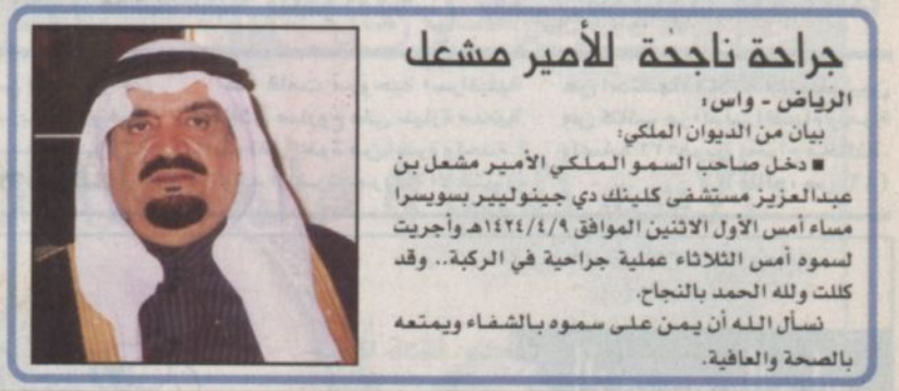
جراحة ناجحة للأمير مشعل

الرياض - واس، صدر أمر ملكي كريم فيما يلي نصه: بسم الله الرحمن الرحيم الرقم ٨١/أ التاريخ ١٤٢٤/٤/٩ هـ يعون الله تعالى نحن فهد بن عبدالعزيز ملك المملكة العربية السعودية بعد الاطلاع على المادة الثامنة والخمسين من النظام الأساسي للحكم الصادر بالأمر الملكي رقم ٩٠/أ وتاريخ ١٤١٢/٧/٢٧ هـ وبعد الاطلاع على نظام الوزراء ونواب الوزراء وموظفي المرتبة الممتازة الصادر بالمرسوم الملكي