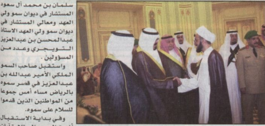
سمو ولي العهد مستقبلاً العلماء والمشايخ ووفداً من أهالي الشرقية (واس)