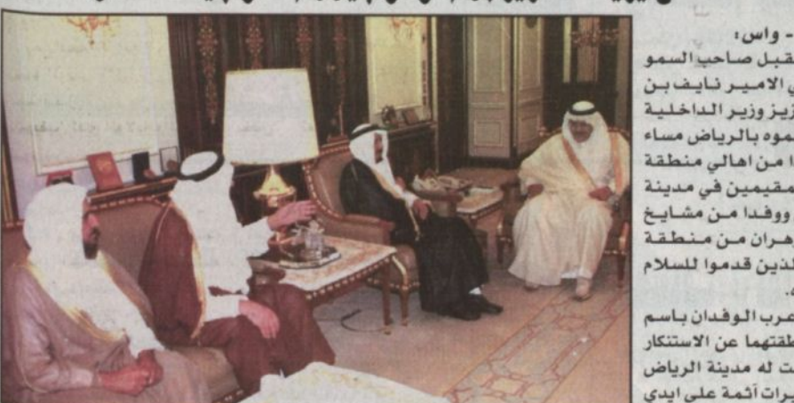
سمو وزير الداخلية يستقبل مشايخ عسير والباحة

الرياض - واس، استقبل صاحب السمو الملكي الأمير نايف بن عبدالعزيز وزير الداخلية بمكتب سموه بالرياض مساء أمس وفداً من أهالي منطقة عسير والمقيمين في مدينة الرياض ووفداً من مشايخ الدفاع وزهران من منطقة الباحة الذين قدموا للسلام على سموه. وقد أعرب الوفدان باسم أهالي منطقتيهما عن الاستكثار لما تعرضت له مدينة الرياض من تفجيرات أتمت على أيدي الفئة الضالة المنحرفة والتي تسببت في خسائر في الأرواح والممتلكات مؤكداً وقوف الجميع صفاً واحداً خلف القيادة الحكيمة ضد كل من تسول له نفسه الإخلال بالأمن والأمان في هذا البلد الأمين. كما هنأ الجميع سموه على ما تحققت من إنجازات أمنية بالقض و التعرف على عدد من مرتكبي هذه الأعمال. وقد أعرب صاحب السمو الملكي الأمير نايف بن عبدالعزيز عن شكره لهم مؤكداً الثقة في الجميع وأن هذه المشاعر الصادقة ليست شريفة على المواطنين