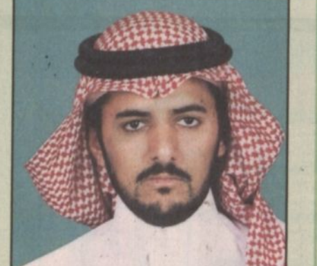
بقلم: علي بن عبدالعزيز الشري

يأتي انعقاد ندوة وزارة المعارف التي تتشرف برعاية سمو ولي العهد... ماذا بعد الندوة؟!