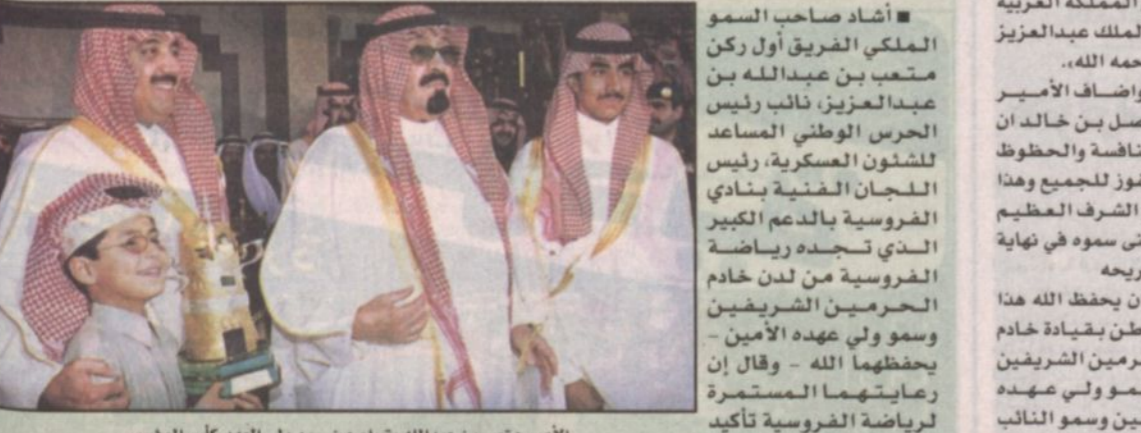
الأمير متعب بن عبدالله يتسلم من سمو ولي العهد كأس المؤسس يوم فازه (طالع الذهب) ١٤٢١ هـ.

احتفال اليوم الكبير تخليد للذكرى العظيمة لفارس التوحيد والبناء