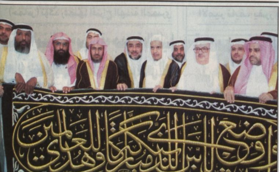
جانب من مراسم تسليم الكسوة لكبير السادة

صنعاء - واس: بعث صاحب السمو الملكي الأمير نايف بن عبدالعزيز وزير الداخلية رسالة لمعالي وزير الداخلية بالجمهورية اليمنية الدكتور رشاد محمد العليوي. وتتلخص الرسالة بعلاقات التعاون بين وزارتي الداخلية في البلدين الشقيقين. وقام بتسليم الرسالة سفير خادم الحرمين الشريفين لدى اليمن محمد بن مرساد القحطاني خلال استقبال وزير الداخلية اليمني له أمس في صنعاء.