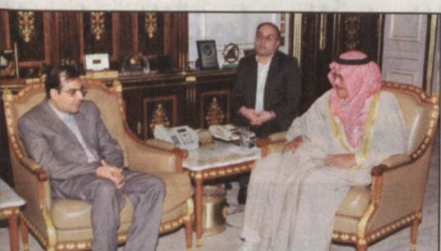
الأمير نايف يستقبل سفير إيران (واس)

الرياض - واس: يقوم صاحب السمو الملكي الأمير نايف بن عبدالعزيز وزير الداخلية رئيس لجنة الحج العليا يوم (الأربعاء) بجولة تفقدية يتطلع خلالها على الاستعدادات ومستوى الخدمات المقدمة من الجهات المشاركة في الحج. كما يقوم سموه باستعراض القوات الامنية المشاركة في مهمة حج هذا العام وكذلك الجولة السنوية على المشاعر المقدسة.