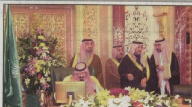
الأمير عبدالله متراًساً اجتماع المجلس الاقتصادي

الرياض - و.أ.س: رأس صاحب السمو الملكي الأمير عبدالله بن عبدالعزيز ولي العهد نائب رئيس مجلس الوزراء رئيس الحرس الوطني ورئيس المجلس الاقتصادي الأعلى (حفظه الله) أمس الأحد اجتماع المجلس الاقتصادي الأعلى الذي عقد بمقر المجلس في قصر اليمامة في مدينة الرياض بحضور صاحب السمو الملكي الأمير سلطان بن عبدالعزيز نائب الرئيس الثاني لرئيس مجلس الوزراء وزير الدفاع والطيران والمفتش العام ونائب رئيس المجلس الاقتصادي الأعلى وأصحاب المعالي الوزراء أعضاء المجلس وأعضاء الهيئة الاستشارية للشؤون الاقتصادية.