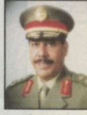
اللواء عبدالعزيز سنجيني

كتب - عهد الزومان: تقوم المديرية العامة للجوازات خلال الأشهر القادمة في البدء بإصدار إقامة العاملين من العمالة عن طريق الحاسب الآلي بحيث يتم استبدالها بالدفتر المطبق حالياً ببطاقة مفضلة تحوي كافة المعلومات. صرح بذلك لـ «الرياض» اللواء عبدالعزيز جميل سنجيني مدير المديرية العامة للجوازات وقال إن هناك لجانا شكلت لهذا الغرض وتجري الدراسة حالياً في المركز الوطني للمعلومات وسيتم اقرار ذلك قريباً.