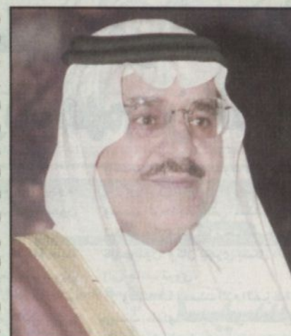
الأمير نايف بن عبدالعزيز

الطائف - اسماعيل ابراهيم: حددت لجنة مكونة من وزارة الداخلية والشؤون الاجتماعية معايير الملتقيات الثقافية للجمعيات الخيرية والاجراءات التي يجب ان تتقيد بها الجمعيات النسائية وتم التعميم من صاحب السمو الملكي الامير نايف بن عبدالعزيز وزير الداخلية والمناطق بإنفاذ توصيات اللجنة والمتضمنة أخذ الجمعيات قبل اقامتها لأي ملتقى ثقافي موافقة وزارة العمل والشؤون الاجتماعية على اسماء المشاركين والمشاركات سواء من داخل المملكة أو خارجها وعلى اوراق العمل والمواضيع التي ستطرح في الملتقى وتقوم وزارة العمل والشؤون الاجتماعية بالتنسيق مع وزارة الداخلية على جميع المدارس الأهلية بالأحذية وتدريب مودا التربية الإسلامية إلا معلم سعودي. وأوضح الأستاذ سالم بن هلال الزهراني مدري التعليم الموازي أن ذلك يأتي انطلاقاً من توطین معلمی التربية الإسلامية واستكمال إحلالهم مكان المعلمین المتقاعدین. وأشار إلى وجوب العمل بهذا بداية العام الدراسي الحالي. مضيفاً أن على مديري المدارس الأهلية عدم تعيين أي معلم متقاعد من تدريس مادة التربية الإسلامية وأكد أن المدارس المخالفة للإحلال ستتم مجازاتها.