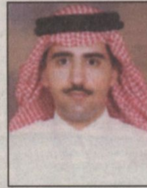
بقلم - خالد عبيد العتيبي*

والسعيدة للمدينة المنورة وابنائها الكرام فابناء المدينة سعداء في لقاء سموه والجميع سعيد بهذه المناسبة العزيزة.