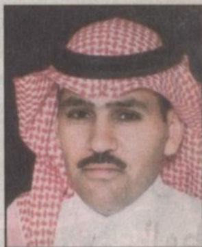
بقلم: فهد صويلح السجيمي*

هؤلاء الرجال الاوفياء المخلصين لآي جزء من ارض وطننا الغالي ما تأتي إلا دعماً لمسيرة النمو والعطاء بها وارساء لقواعد التنمية الشاملة.