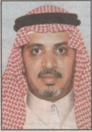
بقلم: فهد محمد السويلم*

على الحرص الشديد من ولاية الامر لراحة المواطنين في جميع مناطق المملكة عامة وفي مكة المكرمة والمدينة المنورة خاصة وتأتي زيارة صاحب السمو الملكي الأمير عبدالعزيز آل سعود ولي العهد