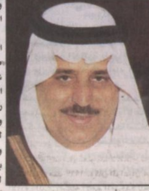
الأمير نايف بن عبدالعزيز

جدة، الرياض - واس: نوه صاحب السمو الملكي الأمير نايف بن عبدالعزيز وزير الداخلية المشرف العام على اللجنة السودانية المشتركة لإغاثة كوسوفا والشيشان بالمساعدات الاغاثية والانسانية السودانية للاجئين الشيشان التي تقدمها اللجنة السودانية المشتركة ممثلة في جمعية الهلال الاحمر السعودي. وعبر سموه عن سروره عقب اطلاعه على نسخة من مجلة الاغاثة السعودية التي أصدرتها جمعية الهلال الاحمر السعودي باللغة الروسية لابرار حضارة للمملكة و جهودها الاغاثية والانسانية في جميع أنحاء العالم وما قدمته لشعب الشيشان. كما أعرب سموه في برفقة تلقاهما من سموه رئيس جمعية الهلال الاحمر السعودي رئيس اللجنة السودانية المشتركة الدكتور عبدالرحمن السوليم عن شكره وتقديره لجهود اللجنة السودانية المشتركة ممثلة في جمعية الهلال الاحمر السعودي في إيصال وتوزيع المساعدات الاغاثية على اللاجئين الشيشان والتخفيف من معاناتهم.