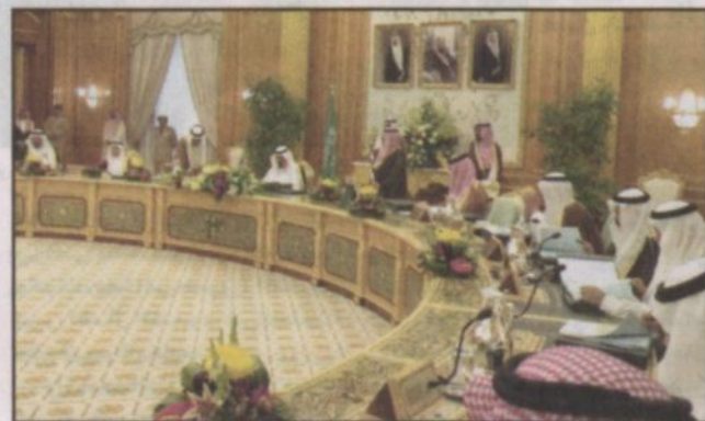
الأمير عبد الله يستقبل وزير الداخلية اليمني

6 - بين النظام التصرفات التي تعد تعدياً على الحقوق التي يحميها النظام.