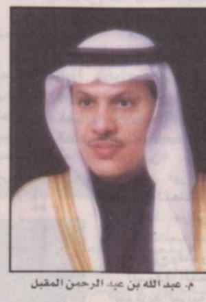
عبد الله بن عبد الرحمن المحجل

وعن مشروع طريق القصيم - المدينة المنورة سيكتفئ وزير النقل لشؤون الطرق المهندس عبدالله بن عبدالرحمن المحجل قائلاً: يعتبر طريق القصيم - المدينة المنورة - ينبع - رابع نول السريع جزءاً من شبكة الطرق الرئيسية في المملكة ويشكل الجزء الأكبر من المحور الرئيسي الذي سيربط ميناء مدينة الجبيل على ساحل الخليج العربي شرقاً بميناء مدينة ينبع على ساحل البحر الأحمر غرباً، كما يشكل امتداد هذا الطريق من ينبع حتى مدينة رابع نول في اتجاه الجنوب ومن ثم إلى مدينة جدة جزءاً من المحور الرئيسي الساحلي لساحل البحر الأحمر من جيزان جنوباً حتى حقل شمالاً، ويناه على التوجيهات السامية الكريمة فقد أبرمت الوزارة بتاريخ ١٤/١٨/٢٠٠٢هـ عقداً مع مجموعة من لادن السعودية لتنفيذ كامل الطريق بطول ٨١٨ كلم على أساس طريق سريع محكم الدخول والخروج، ومكون من اتجاهين بكل اتجاه ثلاث مسارات تفصلها جزيرة وسطية عرضها ٢٠ متر في المناطق المفتوحة وأمتار في المناطق الحضرية ومزود بكافة وسائل السلامة المختلفة من سياجات معدنية في الوسط وعلى الجانبين، واللوحات الإرشادية والتحذيرية وخطوط الدهان والعلامات وغيرها، كما أنه مزود بعدد من التقاطعات العلوية لخدمة التجمعات السكانية الواقعة على جانبيه بالإضافة إلى معابر الحيوانات على شكل جسور علوية.