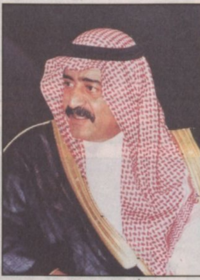
الأمير مقرن بن عبدالعزيز