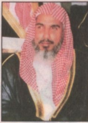
بقلم: د. صالح بن عبدالرحمن المحميد*

أبدينا في يد ولاية الأمر ونراقب الله وحده ونضعه نصب أعيننا ولا نبالي بالأراجيف والأكاذيب والإشاعات الباطلة فهي حرب نفسية يشنها أعداء الدين ويردها فليلو العقل والمعرفة والهدف منها بلادنا وإسلامنا لكن بالوعي والشجاعة والتماثل والإيتار تتحطم كل الحيل وتتكشف كل الألاعيب فأهلاً بولي العهد في بلد رسول الله صلى الله عليه وسلم وأسأل الله تعالى أن يعزبه خيراً على ما عمله وما يريد من عمله من خير في هذه البقعة المباركة وأن يتقبل منه الوقت الكبير الذي جعله لوالديه وأن يحق له ما وعد به رسول الله صلى الله عليه وسلم في قوله: «إنا مات ابن آدم انقطع عمله إلا من ثلاث صدقة جارية أو علم ينتفع به أو ولد صالح يدعو له».