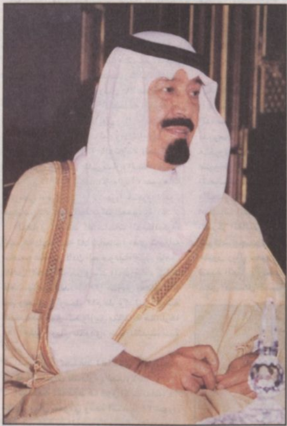
سمو ولي العهد

يهدف إنشاء الطريق السريع إلى ما يلي: - استكمال ربط مناطق المملكة بطرق سريعة وحديثة مصممة على أحدث الأسس الهندسية لاستيعاب نمو حركة المرور وتأمين مستوى خدمة عالٍ وأمن مستخدمين الطريق، اختصار مسافات وأزمان الرحلات وبالتالي تقليل من تكاليف نقل الركاب والبضائع على الطرق، خدمة حركة المرور المحلية للمناطق التي يمر بها عبر تقاطعات علوية حرة الحركة، تشييد حركة النمو والتبادل الصناعي والزراعي والسياسي بين مدن المملكة، تشييد النمو والتوسع العمراني والسياحي للمناطق التي يعبرها المشروع، التقليل من الحوادث