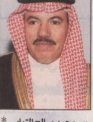
بقلم: محمد صالح التهامي*

من حق كل مواطن سعودي أن يشعر بالسعادة والفخر وهو يطالع بصورة يومية على امتداد الوطن الغالي منجزاً حضارياً جديداً يعلو ويصمخ فوق هذه الأرض المقدسة ليضيف إلى رصيد الوطن التنموي والحضاري الكثير مستهدفاً زيادة التطور والرفق لحياتنا المواطنين السعوديين الذي أصبح يحول الله تعالى وفضله ثم بالعمل للدور والمتواصل ليل نهار من حكومة خادم الحرمين الشريفين وسمو ولي عهد الأمين وسمو النائب الثاني حفظهم الله ورجالهم المخلصين أصبح هذا المواطن ينعم بالرفاهية والرخاء على الرغم من معضلات الاقتصاد العالمي والاقليمي التي تشكل مصاعب ومعوقات أمام الاقتصاد الوطني.