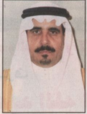
بقلم: م. عبدالكريم بن سالم الحزيني*

إنه من توفيق المولى عز وجل أن قبض لهذه البلاد قادة حملوا الأمانة فكانوا نعم الأمانة وتولوا فكانوا نعم الأمراء - أقر الله بهم الدين وأعزهم بالدين لهم المكانة في قلوب المسلمين عامة والمواطنين بصفة خاصة. إن جولة سيدي صاحب السمو الملكي الأمير عبد الله بن عبد العزيز ولي العهد ونائب رئيس مجلس الوزراء ورئيس الحرس الوطني الشريفية التي تقف على هذا التواضع الجم والتوجه القويم الذي وفق الله إليه قادة هذه البلاد وأتانا نحن أبناء طيبة الطيبة ونحن نحن سعداء بهذه الزيارة الميمونة لسمو ولي العهد - تلك الزيارة التي سبغها الخير والأزهار الكبير فقد تعود أبناء