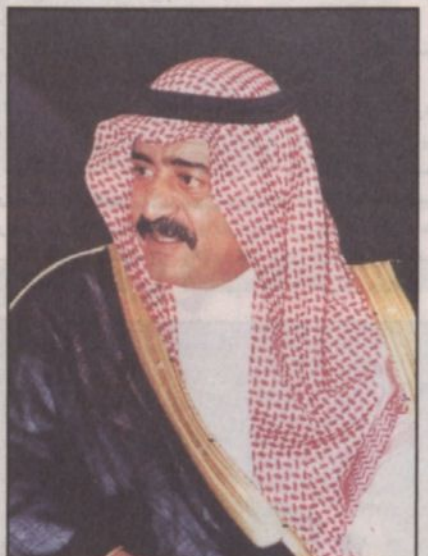
الأمير مقرن بن عبدالعزيز