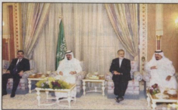
ولي العهد مستقبلاً وزراء خارجية الدول المجاورة للعراق (واس)