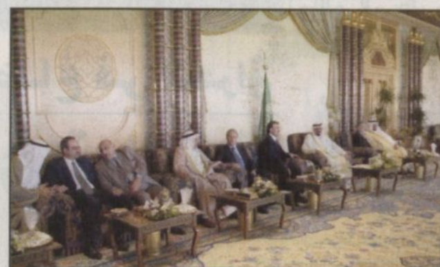
الأمير عبدالله خلال اجتماعه بوزراء خارجية الدول المجاورة للعراق

للشؤون الخارجية ووزير المالية ووزير التخطيط بالوكالة بدولة الكويت الشيخ الدكتور محمد صباح السالم الصباح... وقد أقام صاحب السمو الملكي الأمير عبدالله بن عبدالعزيز حفل غداء تكريماً لأصحاب المعالي الوزراء وعراقهم... حضر الاستقبال وحفل الغداء صاحب السمو الملكي الأمير سلطان بن عبدالعزيز النائب الثاني لرئيس مجلس الوزراء وزير الدفاع والطيران والمفتش العام وصاحب السمو الملكي الأمير متعب بن عبدالعزيز وزير الأشغال العامة والإسكان وصاحب السمو الملكي الأمير بدر بن عبدالعزيز نائب رئيس الحرس الوطني وصاحب السمو الملكي الأمير سلمان بن عبدالعزيز أمير منطقة الرياض وصاحب السمو الملكي الأمير سعود الفيصل وزير الخارجية وأصحاب السمو الملكي الأمراء وسفراء الدول المجاورة للعراق وعدد من المسؤولين.