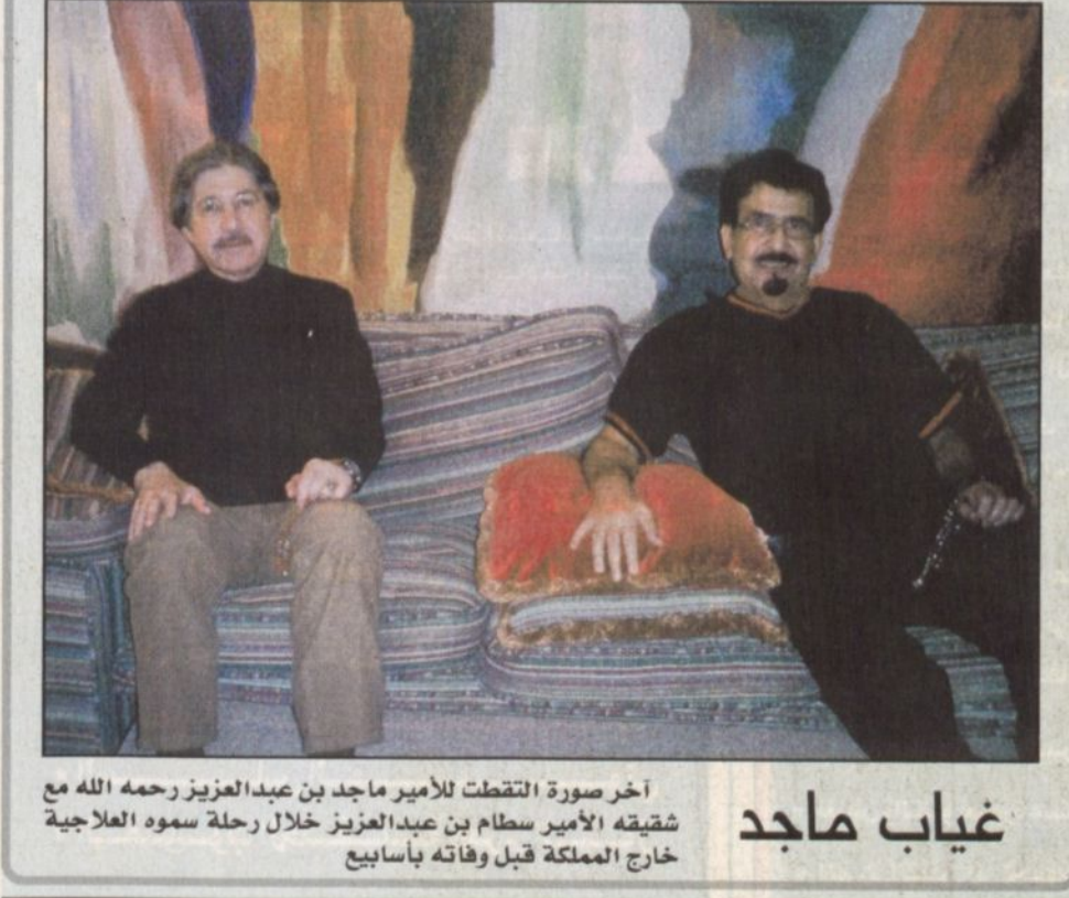
غياب ماجد آخر صورة التقطت للأمير ماجد بن عبدالعزيز رحمه الله مع شقيقه الأمير سطاتم بن عبدالعزيز خلال رحلة سموه العلاجية خارج المملكة قبل وفاته بأسابيع

أسعار خاصة لمشتركي خليك كول مع كول لاين مؤسسة العساكر للأجهزة الكهربائية والتكييف AL-ASAKER