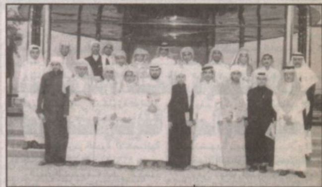
الطلاب خلال الزيارة