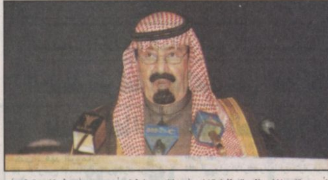
الأمير عبدالله يخاطب منتدى الاستثمار الزراعي في جازان وسهول تهامة أمس

الرياض - رياض الخمسين: أكد صاحب السمو الملكي الأمير عبدالله بن عبدالعزيز ولي العهد نائب رئيس مجلس الوزراء ورئيس الحرس الوطني لدى رعابته أسس حفل افتتاح منتدى الاستثمار الزراعي في منطقة جازان وسهول تهامة أن المملكة اتخذت قراراً استراتيجياً بالسعي لجلب الاستثمارات الوطنية والأجنبية وتوفير كل الحوافز والضمانات والتسهيلات اللازمة لجذب الاستثمارات وتشجيعها في جميع المجالات ومن ضمنها المجال الزراعي كما أكد أن المملكة بما جازاها الله من